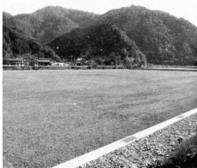
▲造成工事が完了した町民総合運動場