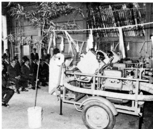
▲消防活動の安全を祈り入魂式が行われました

町では、小原・杉谷地区、国民宿舎山荘甘酒茶屋に小型動力ポンプを更新配備しました。 住民の安全確保のためには消防力の強化が最も重要であり、本町では、従来から平素の訓練活動に意を注ぐと共に、消防施設整備計画に基づいて、消防ポンプの更新配備を行っています。 このたびの小型動力ポンプは、最高出力四十馬力、放水量毎分一トン、B二級車台付です。 これで町内の消防ポンプ台数は二十八台になりました。