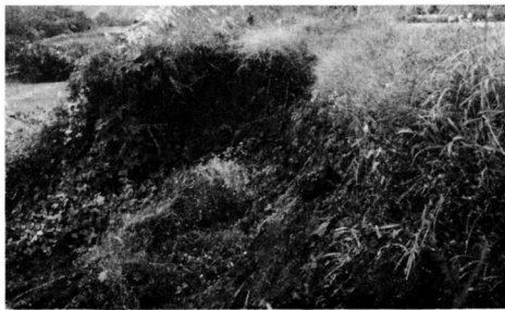
▲7月の梅雨前線豪雨により受けた農地災害(江尾地内)

9月定例町議会は、9月24日から3日間の会期で開かれ、町長提出の全議案を原案どおり可決承認されました。議決された事項は次のとおりです。