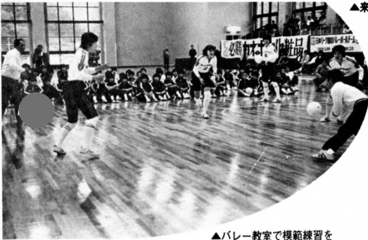
▲バレー教室で模範練習を熱心に見入る受講生

この日は、厳しい練習にも歯をくいしばる彼女たちで完成した体育館は“カネ” 高い声が響く。苦しそうな顔、したたる汗、なおも球にくいつく姿はまさに魔女そのものでした。また、バレー教室は、小、中学生、婦人、