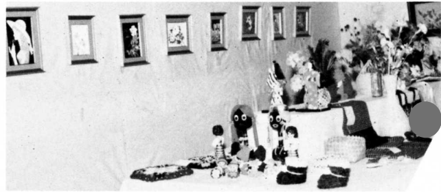
▲明徳学園生の作品

十一月一日から十一月七日までにぎやかに町の文化祭が催されました。今年も、町発足三十周年記念とし、町三十年思い出の写真展、町農協協賛の農協資料展、農産物即売会などそれぞれ趣向をこらした催し物がいっぱい、各会場とも多くの町民でにぎわいました。