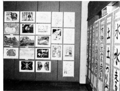
▲児童生徒の作品展