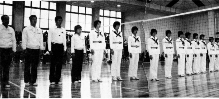
▲来町したカネボウチーム15人

十一月七日、日本バレーリーグのカネボウチーム一五人が、町立総合体育館完成“こけら落とし”として来町し、バレー教室、公開練習、模範試合を町民に披露しました。