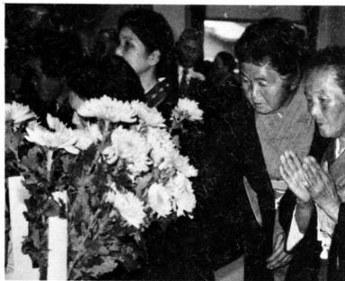
▲献花を行う遺族たち

十一月十二日、土井之内会館で、国難に殉じられた英霊三〇三柱の冥福を祈る戦没者殉職者の追悼式が、来賓、遺族ら二二〇人が参列して厳粛に営まれました。 また、式終了後、遺族の方々は、アトラクションで楽しいひとときを過ごしました。