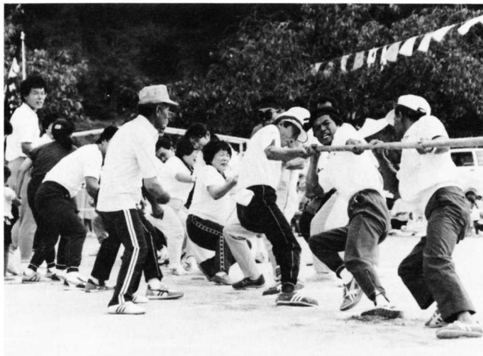
▲ワッショイノワッショイノ (川筋会場)

9月17日、秋晴れの青空の下、町内各地区で町民体育大会が開催され、スポーツで汗を流し親睦を深め、楽しい一日となりました。