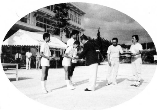
▲スポーツ表彰を行ない、その 榮譽をたたえました。 (米沢会場)