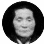
中祖そ免乃 ㊦ (吉原)