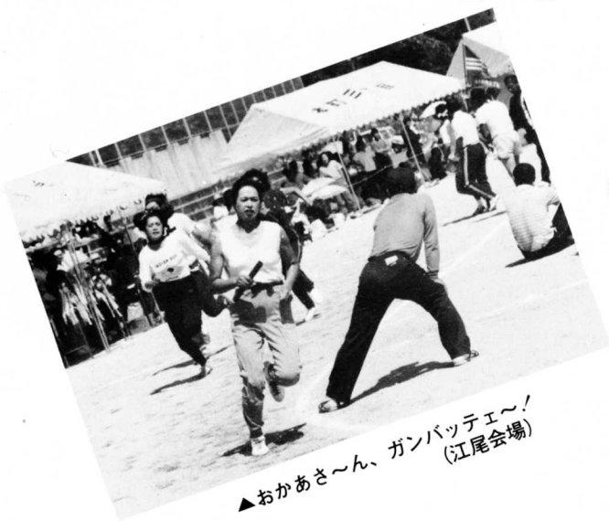
▲おかあさ〜ん、ガンバッテエ〜! (江尾会場)