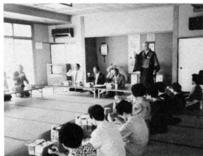
▲長寿を祝って乾杯

り長寿をお祝いしてありますが今年も七九七人に記念品として「手提げカバン」（折りたたみ式）を贈りました。