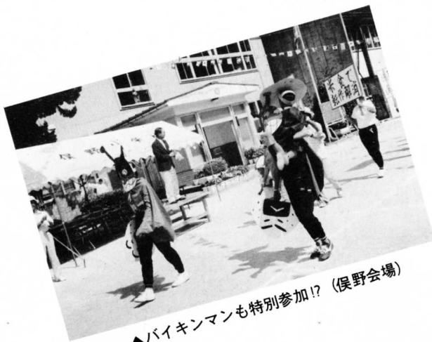
▲バイキンマンも特別参加!? (俣野会場)