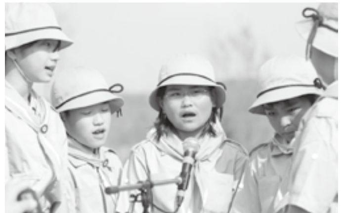
▲真剣な表情で練習に取り組む子どもたち▼