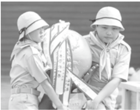
▲大切に植樹祭のシンボル運びます

小学生は式典当日、森・酸素・川・海をテーマにしたダンス、大会のシンボルマークである木製地球儀を知事に渡す役割、国旗・県旗の掲揚といった大きな役割を果たします。