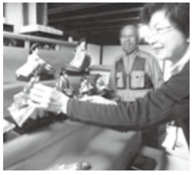
▲準備頑張ってます。お客さんの喜ぶ顔が楽しみ

同者が集まり、晴れてイベントを実施することになりました。準備は文化協会会員の他、地元の方やボランティアも大勢参加し、ひな壇や看板設置・お雛様の細かなレイアウトなど、皆さんが力を合わせてすべて手作業で行いました。 開催期間中江尾駅周辺では、日替わりでお食事処が誕生。また果物や野菜など地元商品も多く売り出され、まさに活気に溢れた一週間となりました。