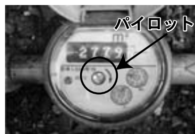
▲パイロットジュニア

なおかつ、町民のみなさんを自分と同じ目にあわせてはならないと、子どもである「パイロットジュニア」を町内各地の水道メーターに送り込みました。ジュニアたちは、その命を受け、漏水のないよう昼夜見守っています。