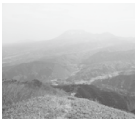
▲展望台から江府町と大山をのぞむ

白馬の会主催で行われるこの祭りは今年で17回目。すっかり江府町おなじみの行事ですが、きつかけは平成7年までさかのぼります。