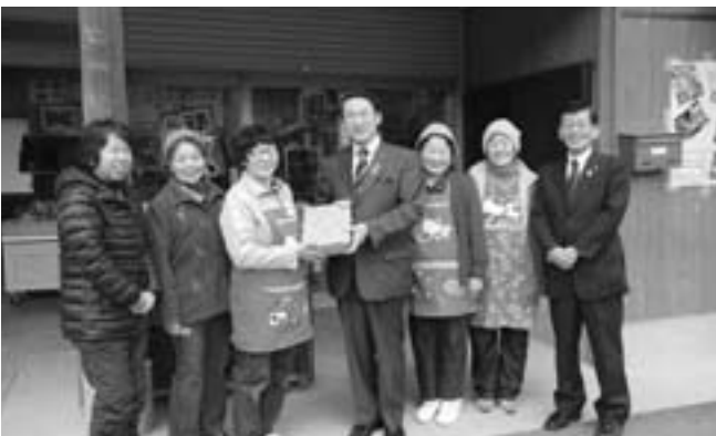
▲みちくさでやたら漬けやかきもち等のお土産をプレゼント