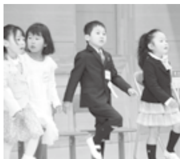
▲元気に「あるく」を歌います