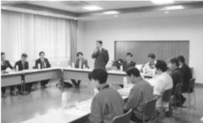
▲健康づくりについて意見交換

祉センターで県・町関係者やあいきょう、地域づくり団体のトンカチ屋さん（宮市）、笑和会（吉原）の皆さんと懇談を行い、主に健康づくりについて話し合いました。会の中で知事は「江府町での先進的な取り組み、住民の方の積極的な活動を聞き元気をもらいました。」と話していました。