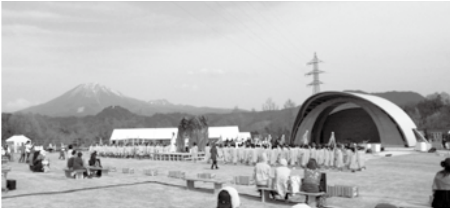
▲総合リハーサルの様子 (とっとり花回廊)

平成25年5月26日(日)に、第64回全国植樹祭とっとり花回廊で開催されます。 全国植樹祭とは、森林や緑への関心を高めるため天皇后両陛下のご臨席のもと毎年各都道府県を巡り開催されている国民的行事です。鳥取県での開催は昭和40年に大山町で開催されて以来48年ぶりとなります。