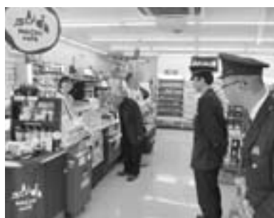
▲商店の方に飲酒運転撲滅を呼びかけました