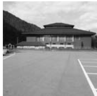
▲中学校新築予定地

中学校体育館は、町民体育館と共用となります。（新たに中学校体育館は新築しません。）