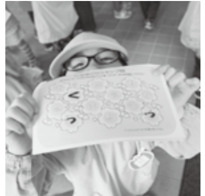
▲みてみて！スタンプもらったよ