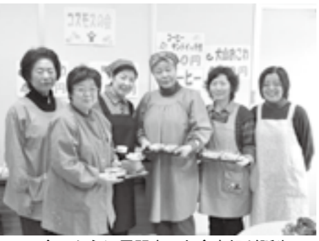
▲今回から江尾駅内にお食事処が誕生 写真はコスモスの会のみなさん