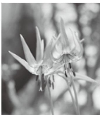
▲光をあびて花ひらくカタクリの花

4月29日(月)、毛無山登山道開き祭が行われ、晴天の中多くの観光客で賑わいました。参加者はリピーターが多く、中には約10年間通い続けている常連さんもありました。毛無山と言えば「カタクリの花」。カタクリは鳥取県で絶滅危惧Ⅱ類に指定されるほど希少な植物で、白馬の会では将来を見据えたカタクリの保護活動にも取り組んでいます。また、今回は環境省などによる植物保護のマナーアップキャンペーンも行われました。