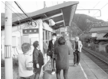
▲武庫駅でのあいさつの様子

期間中は青少年育成江 府町民会議の会員を中心 に50名の方にご協力いた だきました。