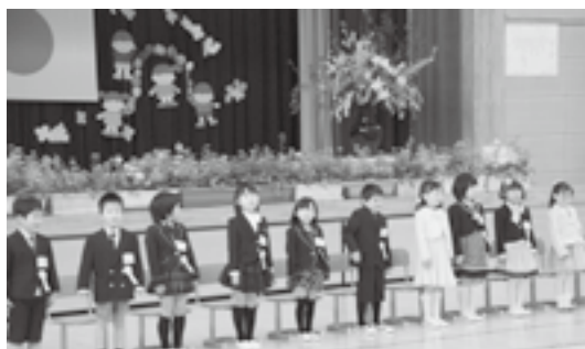
▲みんなおしゃれです

ら歓迎のメッセージと、歌のプレゼントがあり、新入生も一緒に歌いました。ピカピカの一年生がこれからどんなお兄さん、お姉さんに成長していくのか、今から楽しみです。