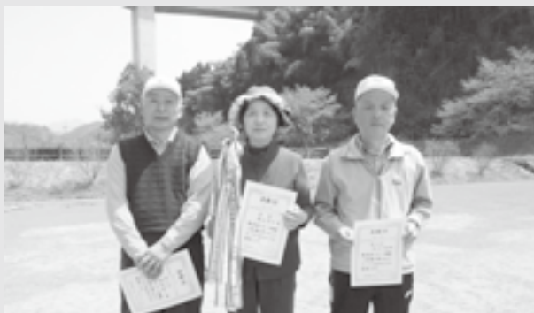
▲賞状を手にする上位3名の方々

4月16日(火)、第20回江府町春季グラウンドゴルフ大会兼郡体予選会が、江府町せせらぎ公園で開催されました。当日は天気も良く、体を動かすのにちょうど良い気温でした。ここでは、大会の結果をお知らせします。