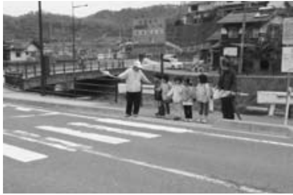
▲みんなで安全確認

4月に募集した下校支援ボランティアでは、17名の方にご協力いただき、13日間にわたって子ども達の下校見守りをしてくださいました。今年は天候が不順で、肌寒い日や雨模様の日もあり、大変だったと思います。ボランティアのみなさんの見守りのおかげで、事故もなく、子ども達も安全に下校することができました。ありがとうございました。