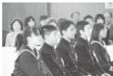
▲学生服姿似合ってます