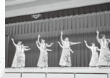
▲公民館講座フラダンス教室