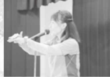
▲NPO水のたねによる手話歌