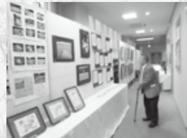
▲作品は力作ぞろい!