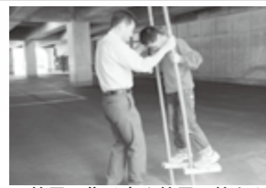
▲竹馬の作り方や竹馬・竹とんぼの遊び方を楽しく教わりました