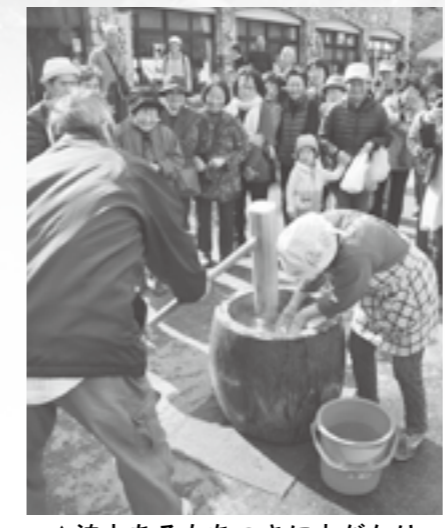
▲迫力あるもちつきに人だかり