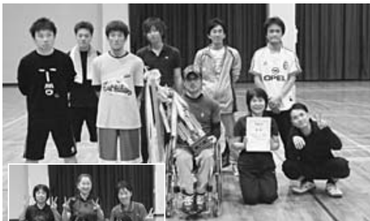
▲優勝チーム 「台のカドには気をつける！byKRC」