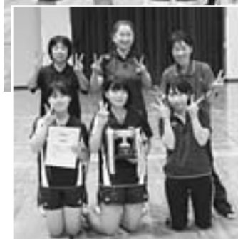
▲準優勝チーム 「ピンポンレディース」