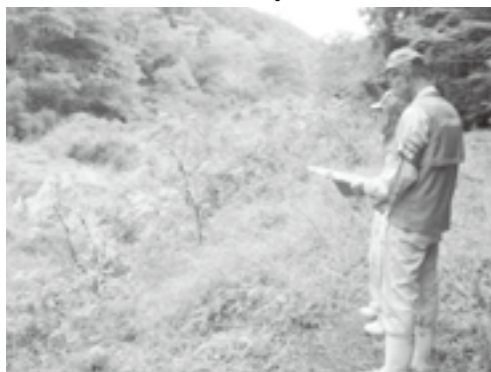
▲農地パトロール実施状況

「私らより若い40代から50代の人たちは農業以外の職業についておられ、平日に農業をする人は少なくなりました。当然のごとく耕作放棄することが多く、私らは体が続く限り耕作するが、次世代はどうなることやら」と話され、課題が多いことを痛感しました。