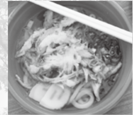
▲野菜たっぷりかき揚げうどん