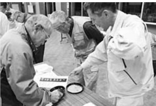
▲資料で確認しながら未熟米を判別します

また勉強会では、良い米の見分け方も勉強しました。初摺り後の米を見ると、緑色をした米や背白・腹白といった未熟粒など、品質上の問題を有する米が混在