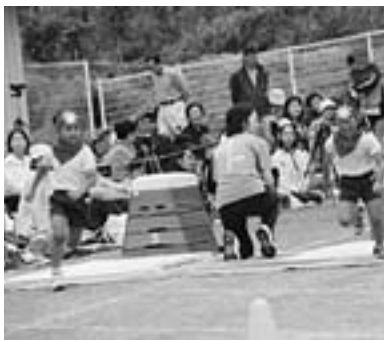
▲忍者になりきって競争