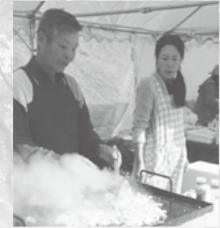
▲いい匂いがしますね!