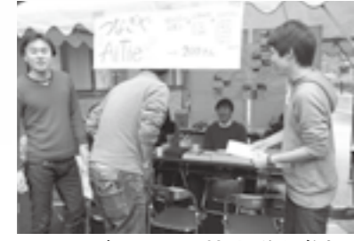
▲つなぎやAitie&協力隊も参加