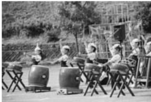
▲すっかりおなじみ子ども太鼓