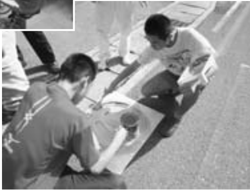
▲ストップマーク塗り