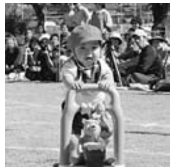
▲小さいお子さんもがんばりました！