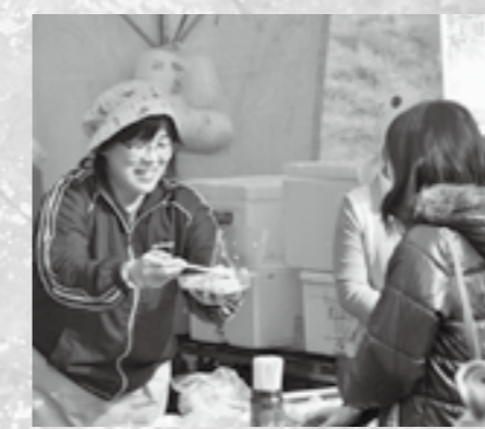
▲どうぞ召し上がれ