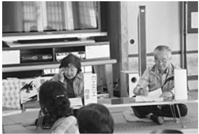
▲寸劇で詐欺事例を学ぶ

また、悪徳商法など、日頃の消費生活で気をつける内容を入れた消費者いろはカルタを全員で行い、楽しみながら学びました。