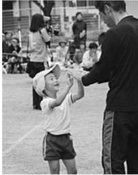
▲お父さんと一緒にポピー体操