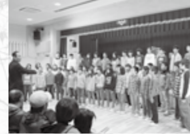
▲江府小学校による合唱

保育園、小学校・中学校、各公民館講座、一般等の多くの方が日頃の成果を発表されました。