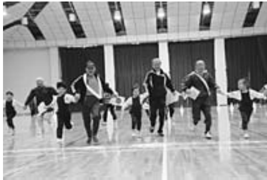
▲園児との合同種目「ともだちみつけた」

10月17日、江府町総合運動公園体育館で高齢者スポーツ大会が行われ、各地区から多くの参加者で賑いました。ボールリレー競争や玉入れ競争、ボール送り競争など熱戦が繰り広げられ、参加者同士で力を合わせて親睦も深めました。また、プログラムの最後には傘踊りも披露され、大会に華を添えました。