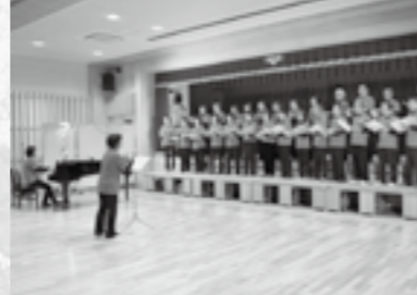
▲アイリス合唱団の発表