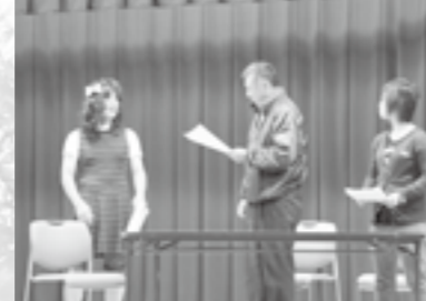
▲男女共同参画審議会による劇