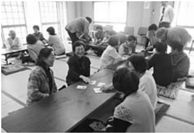
▲かるたで楽しく知識を増やす

また、悪徳商法など、日頃の消費生活で気をつける内容を入れた消費者いろはカルタを全員で行い、楽しみながら学びました。