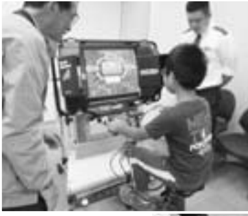
◀自転車シミュレーション

また、合わせて自転車運転の講習会を開き、シミュレーターを使いながら自転車運転の注意点を どを理解してもらいました。