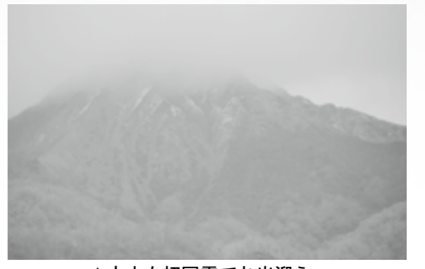
▲大山も初冠雪でお出迎え