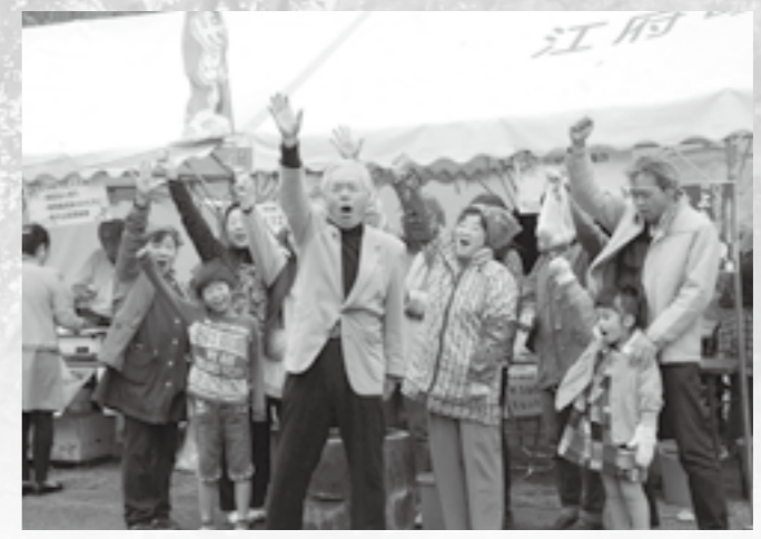
▲美味しいもん祭頑張るぞー!