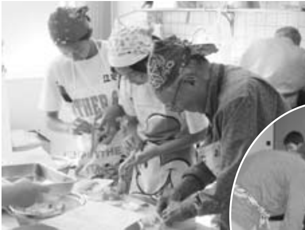
▲明德学園生と中学生の交流の様子

中学生が参加したのは午後から各会場に分かれ て行われる「専門課程」で、11ある専門課程の内 グランドゴルフ、茶道、陶芸、料理、書道の講座 に参加され、明德学園生の方と自己紹介をした後 一緒に受講し交流を深めました。