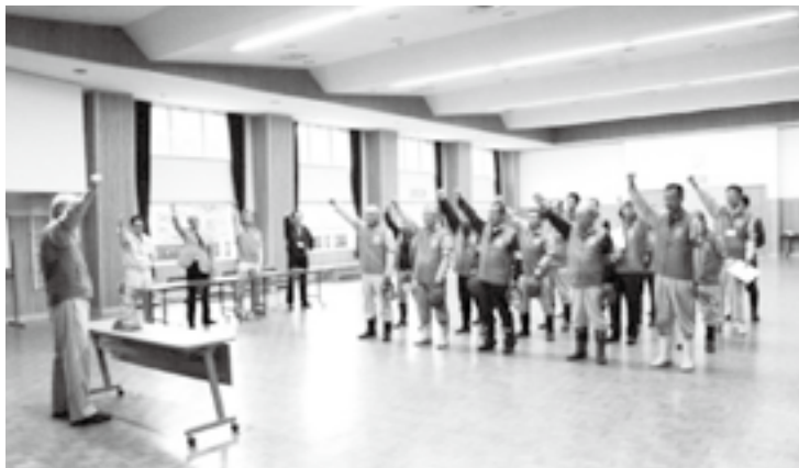
▲農地パトロール出発式

調査には、JA日野営農センター、鳥取県日野振興センター、鳥取県農業共済組合、農林