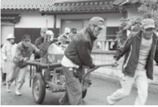
▲貝田集落の自主防災組織による消火訓練

10月5日、江府町総合防災訓練が行われました。町では毎年10月第一週を「江府町防災の日」と定め、防災意識の高揚と災害時の迅速な対応を図ることを目的とし、訓練を行っています。今年には貝田集落で消防訓練を実施。自主防災組織による消火活動や集落の皆さんが参加した避難訓練が行われ、有事に備えてテキパキと訓練が行われました。また、尾之上原集落では、10月4日から5日にかけて、集会所に泊まり込