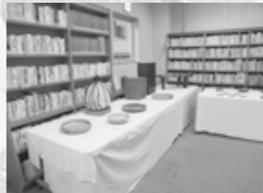
▲木工芸同好会の作品