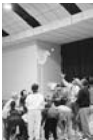
▶白熱する玉入れ競争