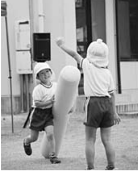
▲バトンタッチまでもう少し！

10月4日、子供の国保育園の運動会が行われ、園児や保護者、地域の方で賑いました。この日は全14プログラムが行われ、日頃から練習を重ねてきた園児たちは、会場を所狭しと元気に活躍しました。園児の一生懸命でかわいらしい姿に、会場は笑顔に包まれました。