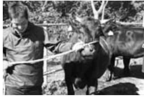
▲足取り軽くトラックへ向かう放牧牛

事に放牧を終えることができました。奥大山の大自然のもとでのびのびと過ごした牛たちがこの日で放牧場を離れ、懐かしい我が家に帰ります。名残惜しそうにトラックに乗る牛もいれば、まだ帰りたくないという牛も…。今年月平均30頭の牛が放牧され、町内外6名の生産者の牛が放牧されました。