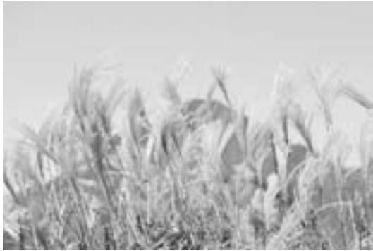
▲放牧場のススキが秋の訪れを感じさせます

事に放牧を終えることができました。奥大山の大自然のもとでのびのびと過ごした牛たちがこの日で放牧場を離れ、懐かしい我が家に帰ります。名残惜しそうにトラックに乗る牛もいれば、まだ帰りたくないという牛も…。今年月平均30頭の牛が放牧され、町内外6名の生産者の牛が放牧されました。