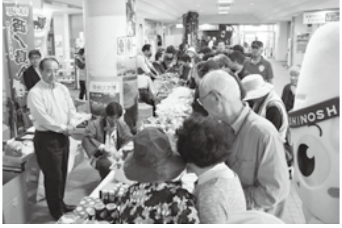
▲新鮮な江府町の野菜などが大人気

本年度も江府町の姉妹町、西ノ島町との経済交流が行われました。10月26日には、西ノ島町の「イカ・まぐろまつり」において、江府町の物産を実施しました。江府町の新鮮な野菜や、味噌、ケチャップ、焼きドーナツなど様々な特産品を販売しました。特に野菜はとても好評で、あつという間に品切れとなりました。11月1日には、鳥取西部農業協同組合江府支所主催の「江府支所ふれあいまつり」において、西ノ島町のマグロ