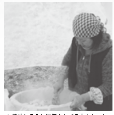
▲美味しそうに湯気をたてる大山おこわ