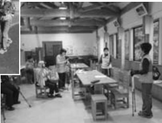
ノルディックウォーク講習会