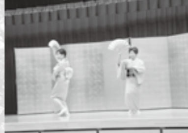
▲あやめ会による日本舞踊