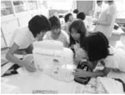
▲ミシンにあわせて布を動かすようにしようね

小学校では、5・6年生が家庭科の学習の中でミシンを使います。ミシンはとても便利な道具ですが、慣れるまでは、糸が絡まったり針が折れたり大変。そこで、お助け隊のみなさんが、ミシン実習にかけつけ、指導をしてくださいました。