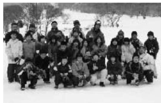
▲指導員さんと記念撮影、ピース!!