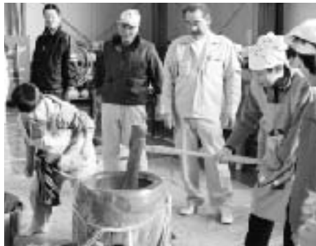
▲なかなかいい手つき!!