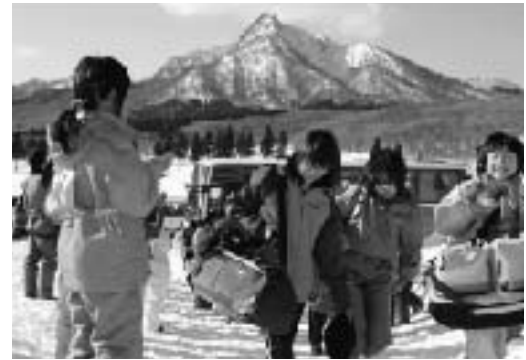
▲ロッジ前で出迎え「ようこそ」

一月三十日から二月一日まで、第二十八回江府町・西ノ島町交歓スキー教室が行われました。姉妹町交流の一環としてこの教室に参加したのは、両町の五年生児童六十名（江府町三十九名、西ノ島町二十一名）。暖冬で直前まで雪不足が心配されましたが、前日の積雪と晴れた空で当日の鏡ヶ成スキー場は絶好のコンディション。夏の臨海学校から交流を深めてきた児童たちは、再会を喜びあいながら、元気いっぱいスキーを楽しみました。両町児童がともに過ごすのは二日間でしたが、スキーのほか学校紹介やレクリエーションなどさまざまな交流を通して友情を確かめました。