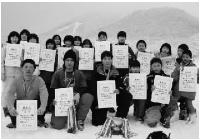
▲江府町の入賞者 みんなそろって