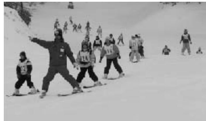
▲方向転換もバッチリ!!