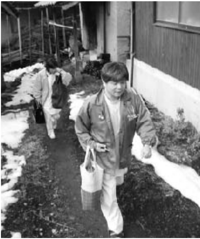
歩いて往診に向う武地医師と看護師

そして、江尾地内のお宅に介護にあたる家族の方は、「先生、お世話になります。膝が痛くて、歩けないというもの