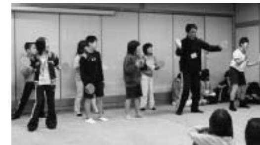
▲隠岐民謡「しげさ節」見事！