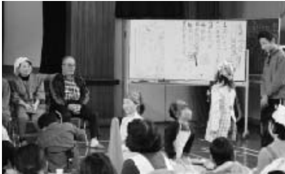
▲「もちつきは楽しかったし、おもちもおいしかったです」