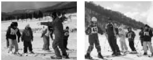
インストラクターさん、熱血指導!!