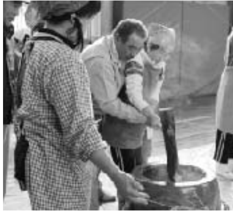
▲ベテランの技を伝授してもらいます

つきあがった餅は、早速、黄な粉もちやぜんざいにしていただき、みんなでおしくつきたてを味わいました。