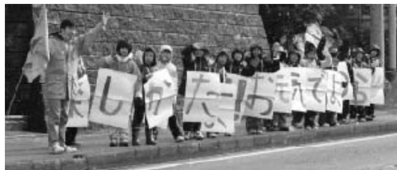
▲江尾小のみんなが国道沿いでバスを見送りました