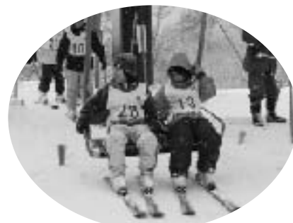
▲リフトにも余裕の笑顔で

この日は、朝から降り続く雪と時折吹きつける強い風の中でのスキーとなりましたが、子どもたちは早速リフト乗り場へ。指導員のみなさんの熱心な指導でめきめき上達し、ちょっぴり自信をつけた西ノ島町の児童たちは「高いところからも滑ってみたい」と、第2リフトにチャレンジ。雪がやみ、少しずつ晴れ間ものぞきはじめた昼前には、21人全員がストックなしでバランスよく見事にすべりおりました。短期間でしたが、初めての雪山とスキーの楽しさを満喫、お土産で少しふくらんだ荷物を手に帰路につきました。