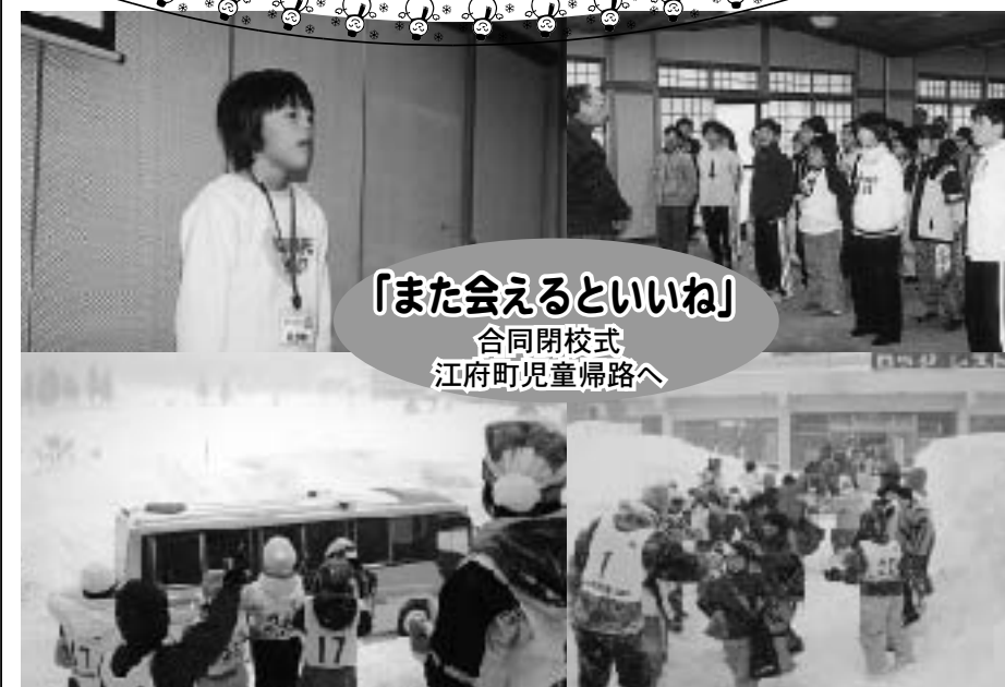
「また会えるといいね」 合同閉校式 江府町児童帰路へ