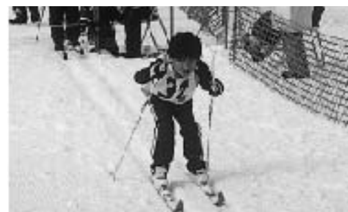
小学校低学年男子スタート (クロス)