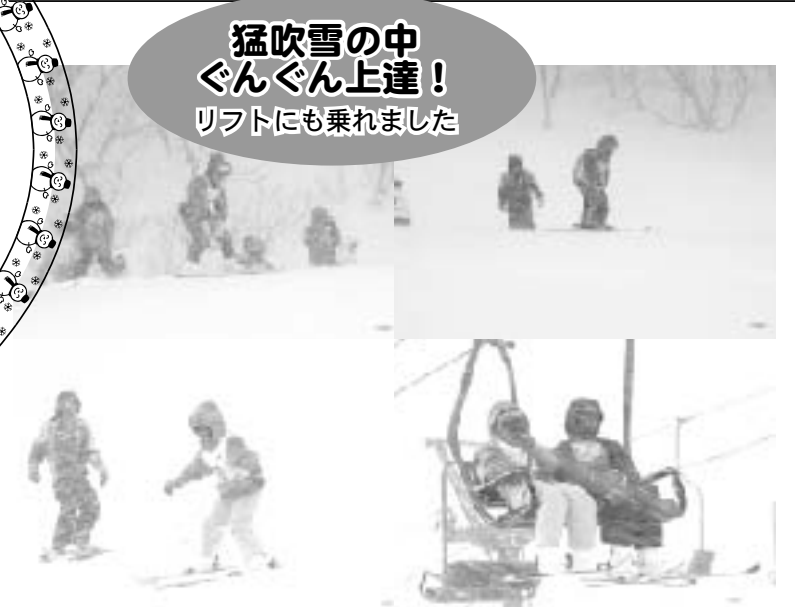
猛吹雪の中 ぐんぐん上達！ リフトにも乗れました