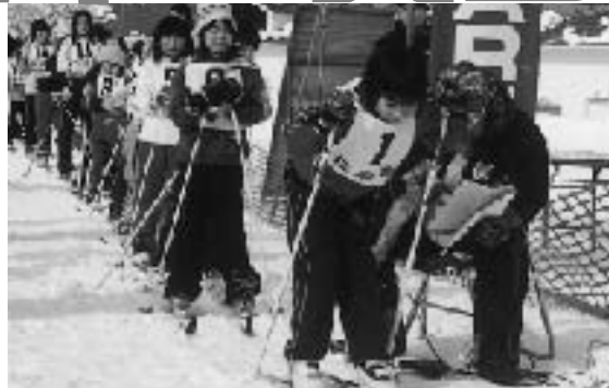
小学校低学年女子スタート (クロス)