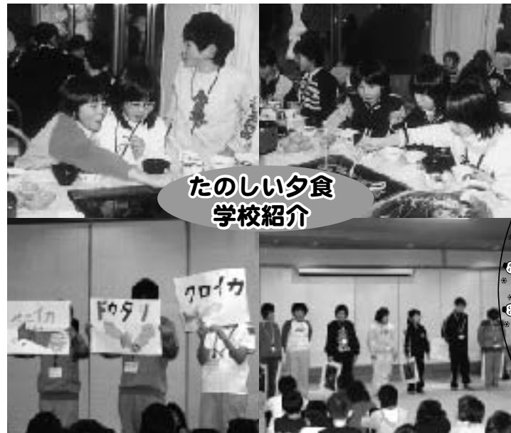
たのしい夕食 学校紹介