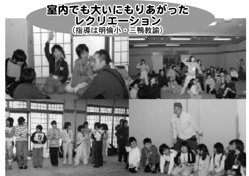
室内でも大いにもりあがった レクリエーション (指導は明倫小・三鴨教諭)