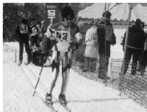
中学校男子スタート (クロス)