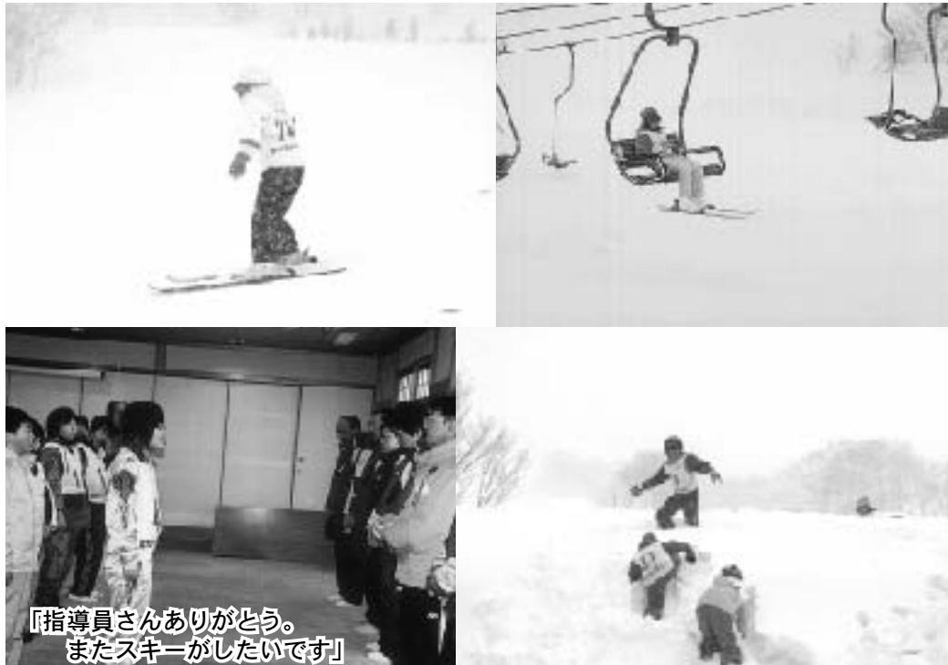
「指導員さんありがとう。 またスキーがしたいです」