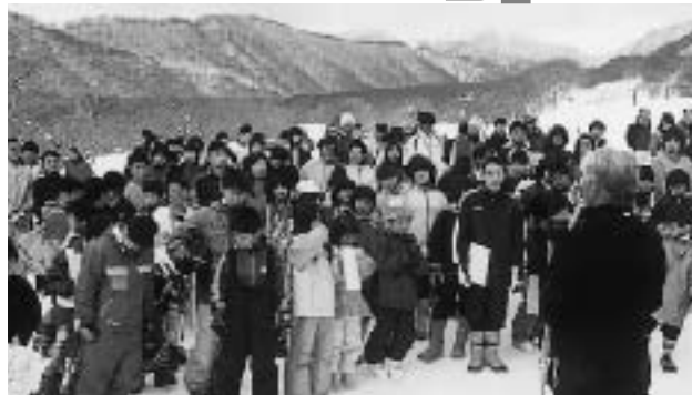
大会当日は絶好のコンディション