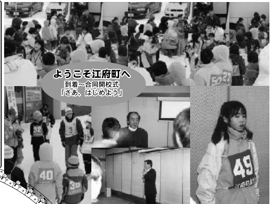
ようこそ江府町へ 到着～合同開校式 「さあ、はじめよう」