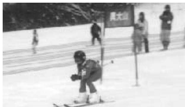
最後の旗門通過 (大回転)