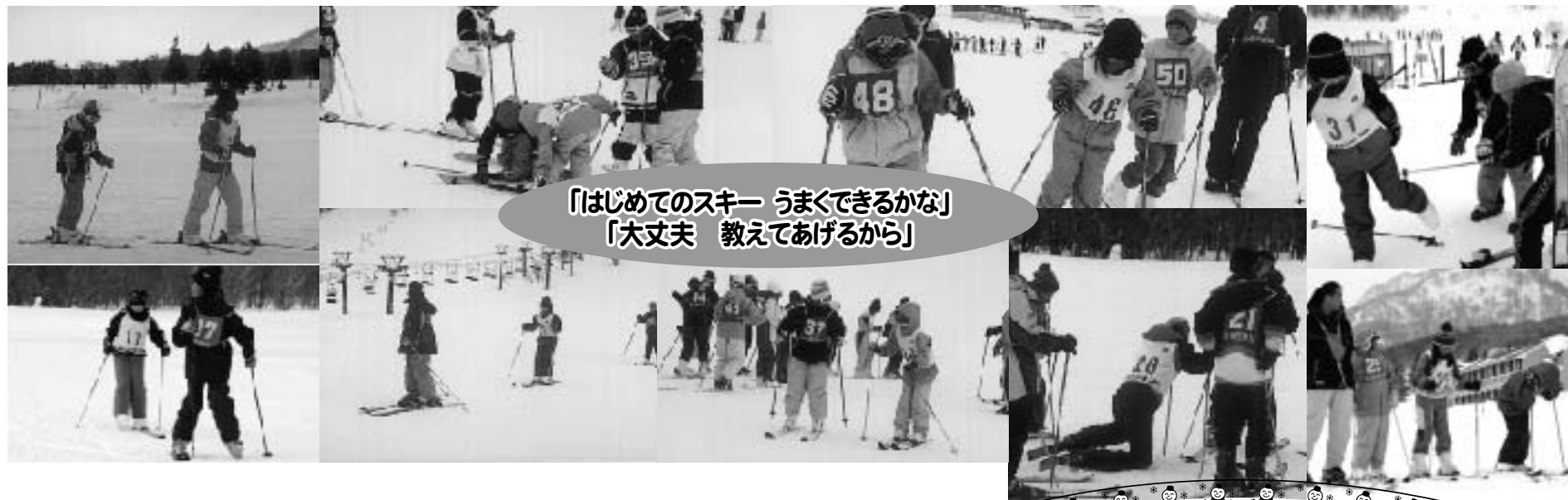
「はじめてのスキー うまくできるかな」 「大丈夫 教えてあげるから」