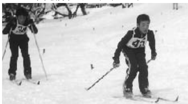
追いつけ追い越せ