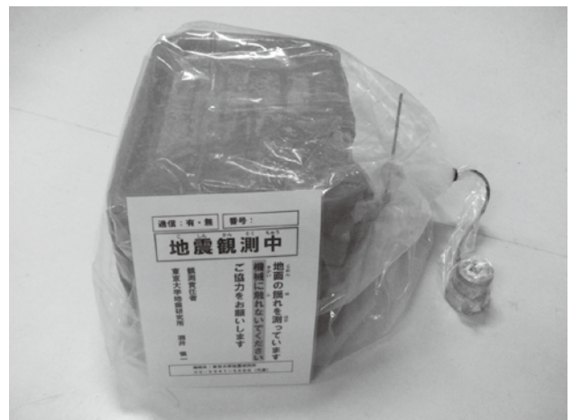
▲設置される地震観測装置