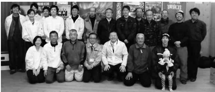
▲イベント終了後の記念撮影

2月13日(月) 御机ふれあいセンターで、御机共生の里そば打ち体験イベントが行われました。御机集落、サントリー、県、町などの関係機関約30人が集まり、昨年同集落で生産したそば粉を使い、そば打ち体験を行いました。前日までの雪が降っていたため開催が危ぶまれましたが、当日は天候にも恵まれ、参加者は講師の指導のもと思いのそばを作りました。そば打ちの後には早速、試食ということで、参加者は暖かいそば、冷たいそばをそれぞれ食べ、味の違いのの違いを楽しみました。