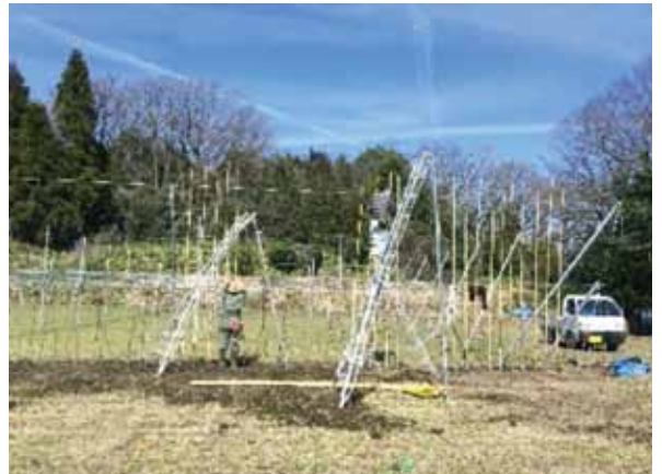
▲梨農地に、ポットごと苗を定植しています (H28年3月)