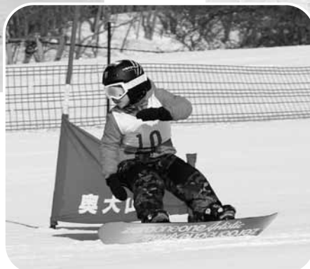
▲スノーボード 大回転