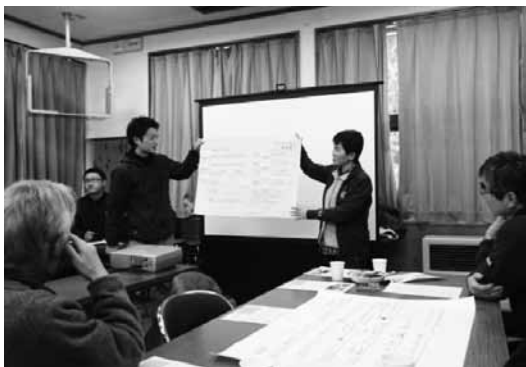
▲活発な意見交換で有意義な会議でした