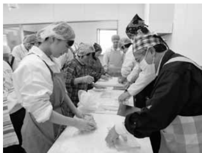
そば打ち体験風景▶