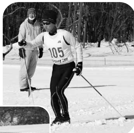
▲ノルディックスキー