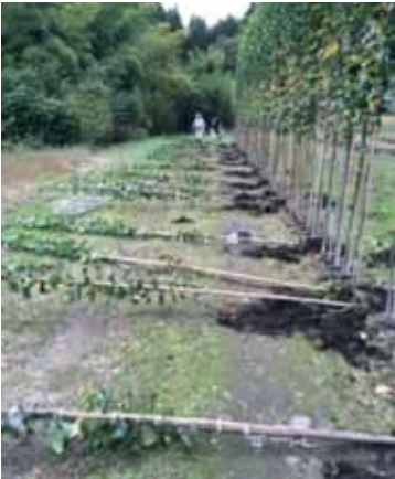
▲成長した苗をポットごと掘り起こしています。折れないように慎重に運びます (10月)