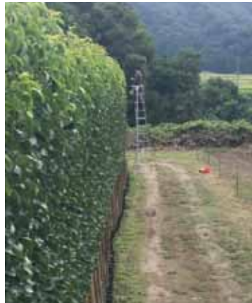
▲台風に備えて、支柱に苗を誘引しています。(9月)