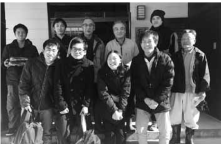
▲貴重な下蚊屋荒神神楽体験