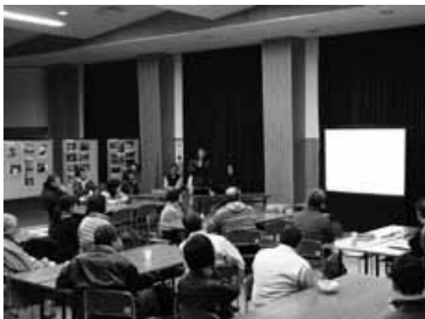
▲約30名の町民が報告会に参加しました

3月23日(木)、江府町山村開発センターにおいて江府町地域おこし協力隊合同報告会「私たちのキセキ」が開催され、町で活躍中の地域おこし協力隊8名の内、7名が活動内容を報告しました。