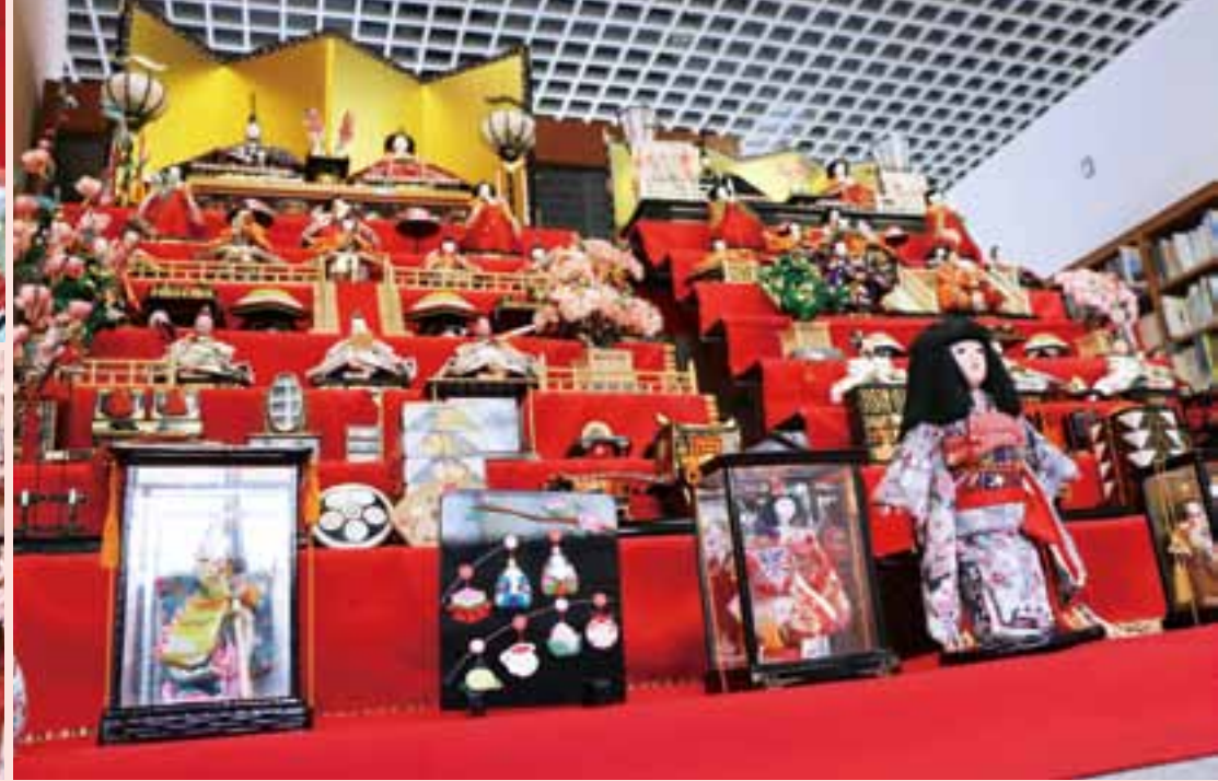
なかなかお目にかかれない昔の人形もたくさん展示されました