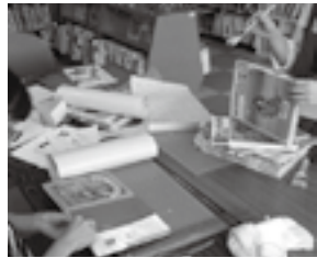
毎月：図書ボランティア