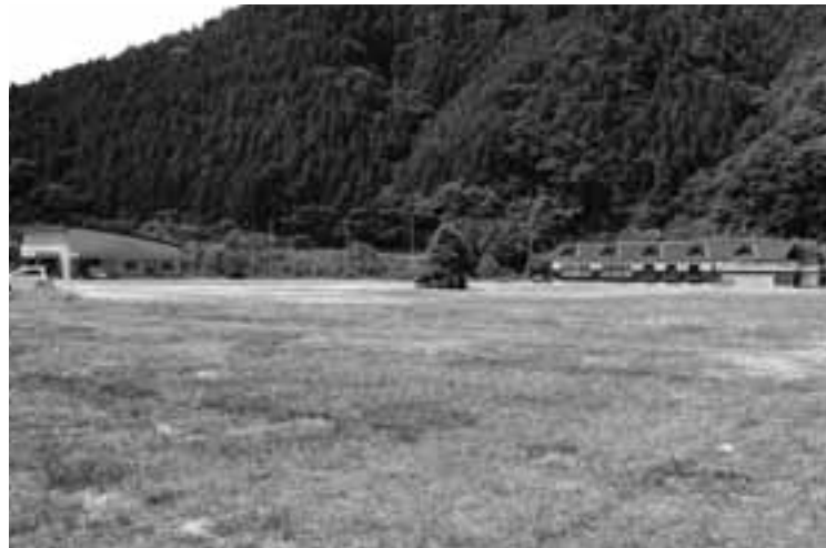
▲現在の旧江府中学校跡地

なお4月1日、2日には住民説明会を開催し、建設予定地決定までの経過や今後の予定などを説明しました。参加者からは「分庁舎を解消した場合、それらの施設はどのように活用していくのか」「江尾の町中から庁舎が移動すると、通いにくくなるのでは」などご意見をいただきました。説明会の様子は動画サイトYouTubeで公開しています。