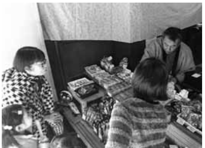
空き家が人の笑顔が集う場所になりました