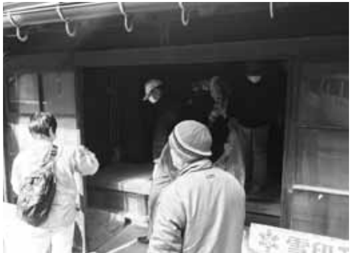
まずは掃除から!! みんなで準備も頑張ります

空き家は様々な活用方法により、町民の皆さんが交流できる場所、町内を元気にしていく拠点として活動できる場所となるのです。