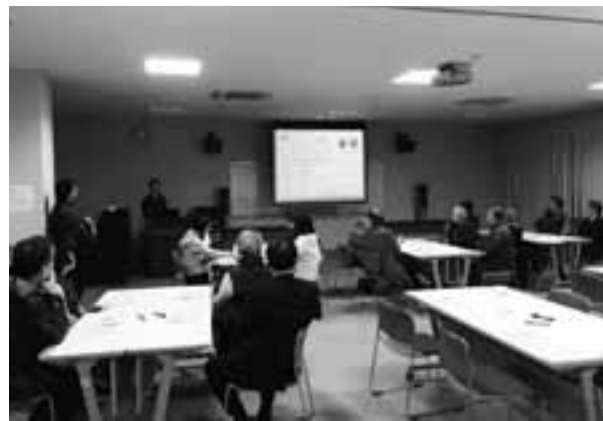
▲半年間の活動報告を行いました

さて、半年間の私たちの活動の中で3000人の楽しい町にするために見えてきたことがあります。