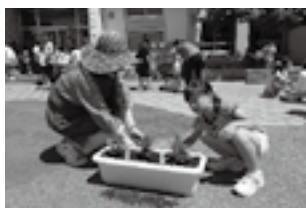
11月：ふれあいの花活動