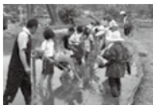
5月：稲の手植え体験