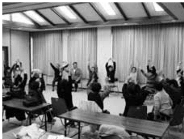
▲転倒防止のため、座ってできる簡単な体操で筋力アップ!