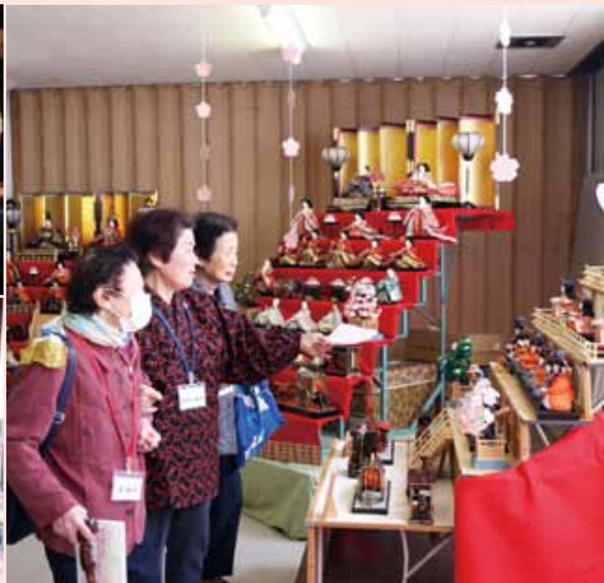
友達と一緒にスタンプラリー♪