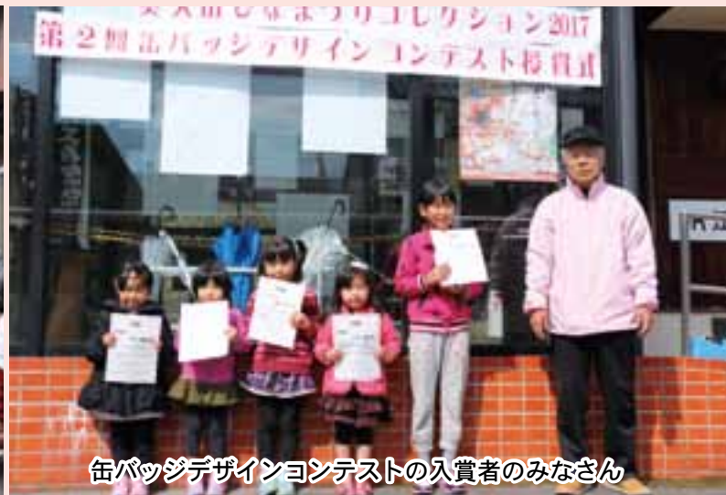
缶バッジデザインコンテストの入賞者のみなさん