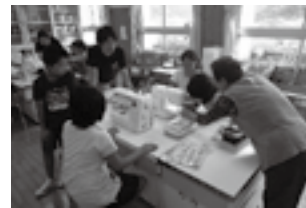
10月：家庭科裁縫実習