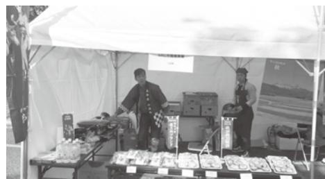
▲↑販売のこともさせて頂いています