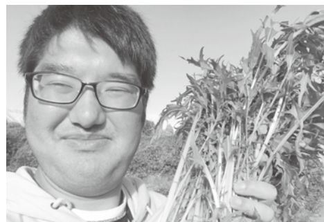
▲しっかりと水菜ができました