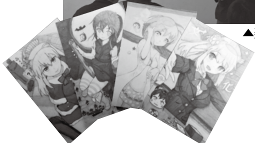
▲日野高生が考えた江府町のキャラクター