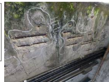
コンクリートの鉄筋露出