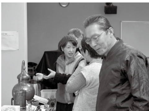
▲珍しいものに興味津々!