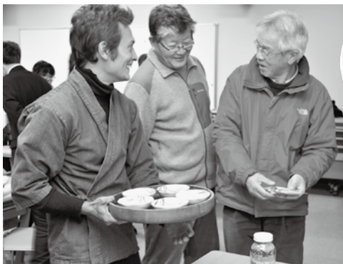
▲ざっくばらんにトークタイム

2019年度はいよいよ最終年度。それぞれ任期後に向けた活動を行います。ワークショップ等のイベントも実施予定ですので、ぜひご参加ください!