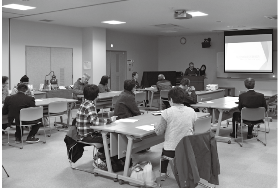
▲慣れないながらも、想いを込めて発表しました