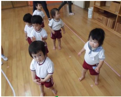
あひる組さんも、体操で体を動かしています！