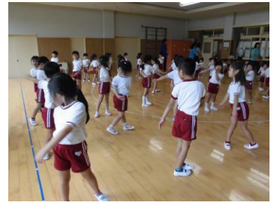
体操をしています。 体をひねって・・・