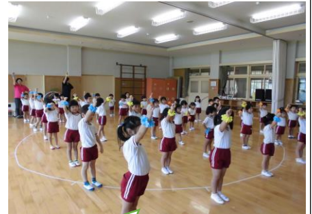
ダンスの練習中！のりのり！ 「右・左」など、左右も理解してきています。

9月のテーマは「からだ（空間を学ぶ）」でした。からだについてのお話を聞いたり、体を使っていろいろな動きを楽しんだりし、運動会に向けて活動を進めてきました。