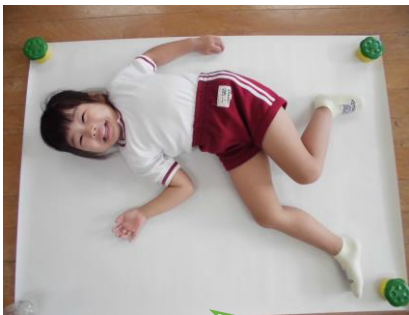
こんなポーズにしてみよう！等身大の型を取っているきりん組さん。ポティーイメージを育てます！