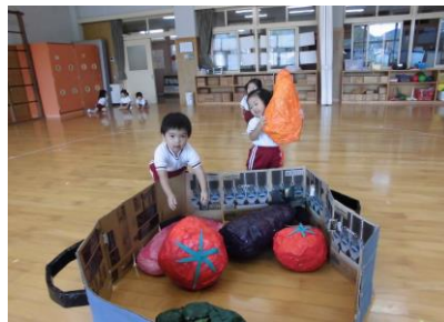
「よいしょ！よいしょ！」 運んでいくよ！