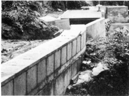
▶完成した原林水路

水不足を解消 日の詰地区では、毎年田植えの時期には水不足のため交代で水番を行い、水を確保していましたが、このほど原林水路が完成し、地元の人は大よろこび。 この水路は、総工事費は九五〇万円、延長七七〇m、水管が設置されています。