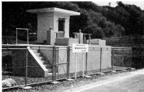
▲助沢地区飲料水供給施設水源地

私たちが月々納めている国民年金、厚生年金の掛金は、国庫に積立てられて老後に直接年金として給付されることになっていますが、国はこの積立金の有効な利用を図るため、一定の割合で、町村の社会福祉施設、スポーツ施設、個人の住宅整備資金として融資を行っています。昭和五十七年度本町では、この融資を受けて次表のとおり事業を行いました。