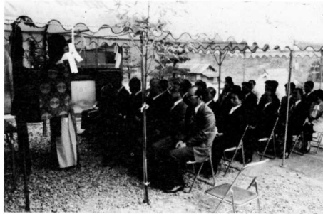
▲助沢地区の水道しゅん工式