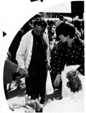
▶ 全国に特産品をアピール

昭和六十年、「まちとむらの交流促進大会」は、十月二十六、二十七日の両日、好天に恵まれた東京代々木公園において、佐藤農林水産大臣をはじめ構造改善局幹部の来賓が臨席、三十五万人の人の出で開催されました。