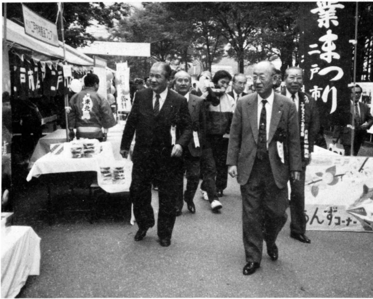
▲会場をみて回る佐藤農林水産大臣、井上町長ほか大会関係者