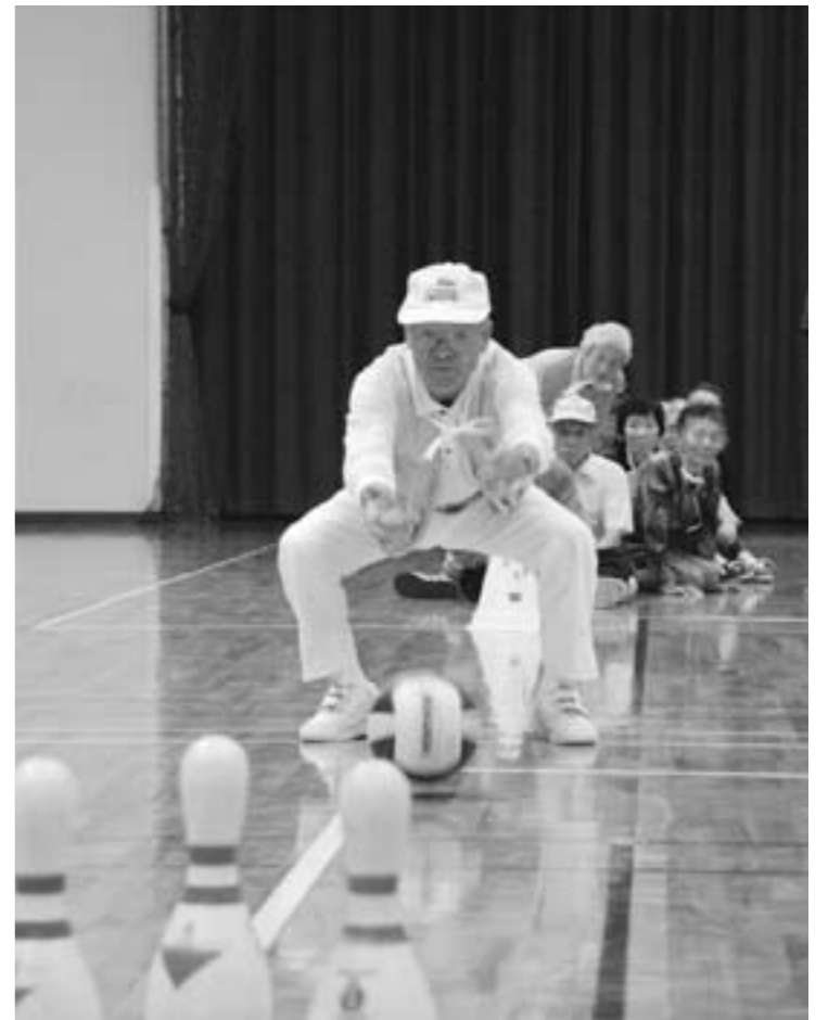
高齢者スポーツ大会