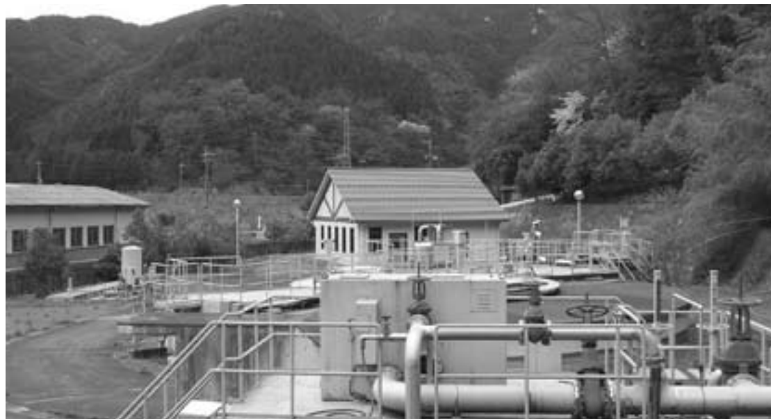
公共下水道処理場