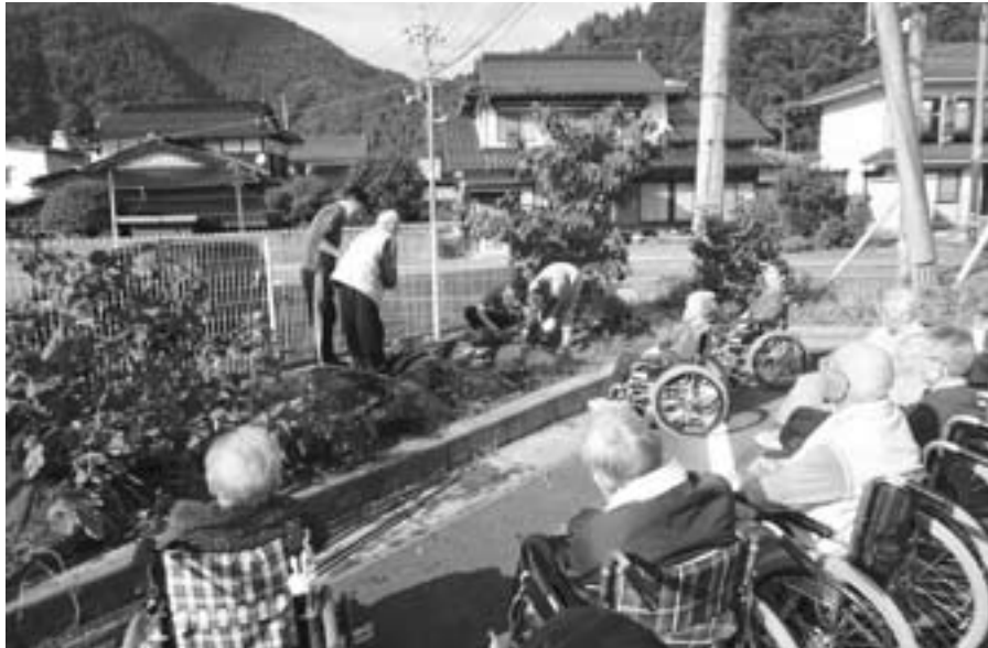
老健施設あやめ 作業風景