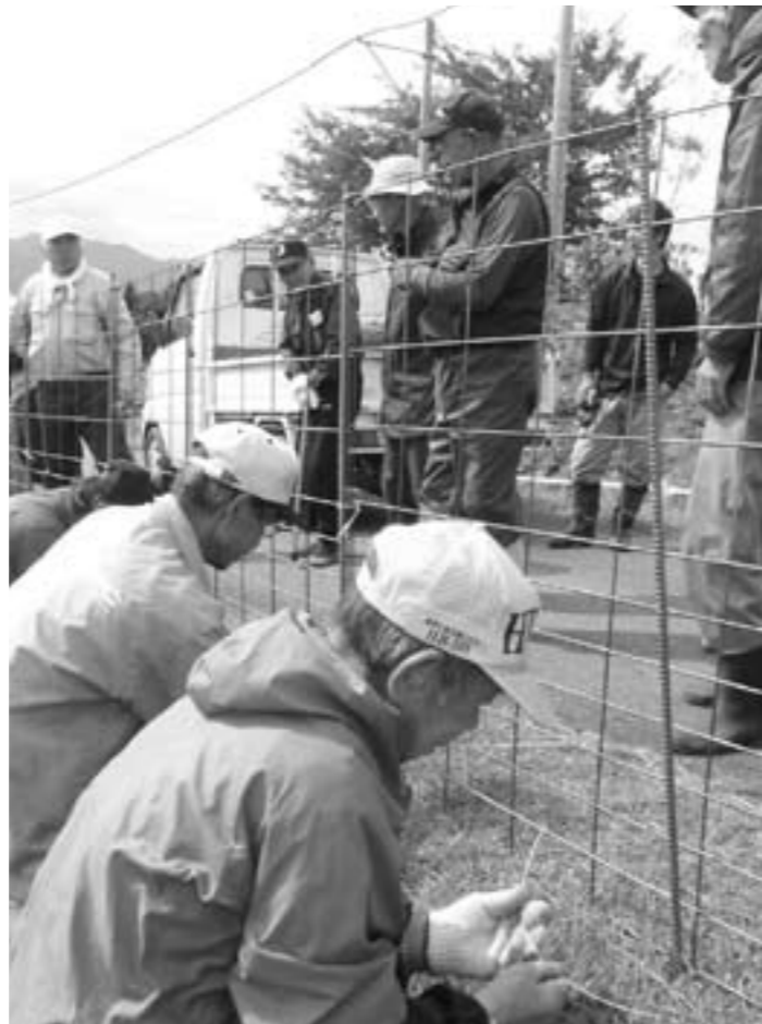
大河原イノシシ柵設置