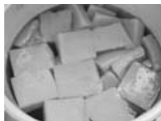
▲手づくりこんにゃく