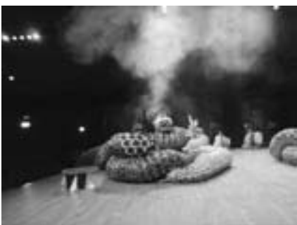
▶ 迫力ある神楽を披露