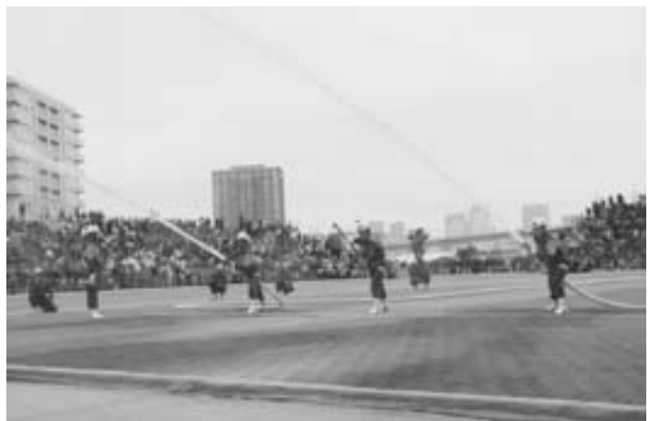
▲素早く的確な操法を披露