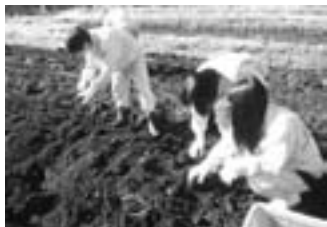
◀収穫に励む生徒達