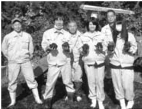
▲楽しみに待ったコンニャク収穫