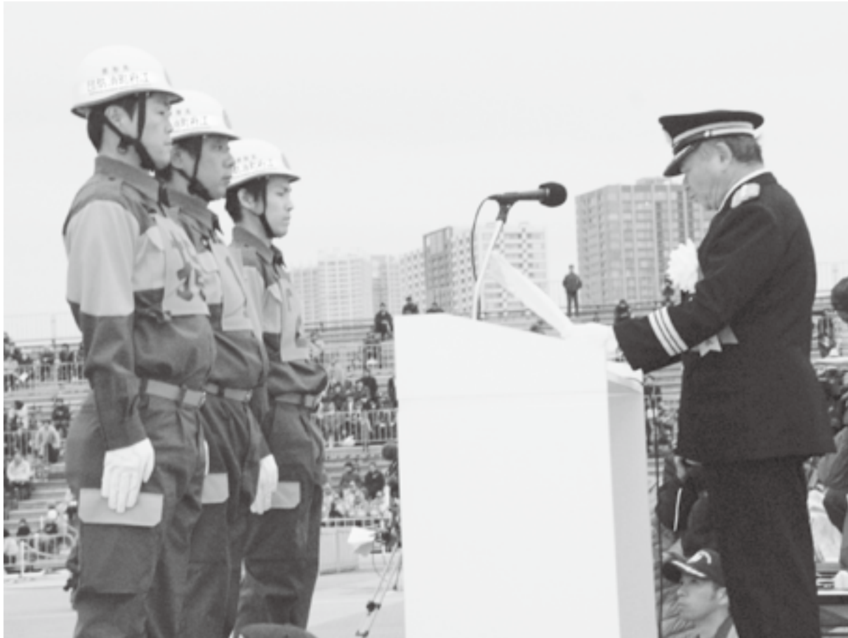
▲日本消防協会会長から準優勝の表彰を受ける江府町消防団

全国消防操法大会とは消防庁及び日本消防協会主催で行われ「消防団の甲子園」とも呼ばれています。2年に1回開催され、各都道府県予選を勝ち抜いた48消防団が、ポンプ車の部、小型ポンプの部の2部門に分かれて、速さ、正確性、規律の正しさを競い合います。