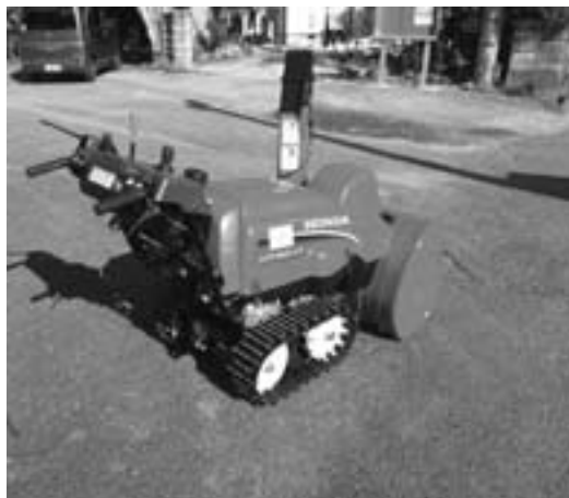
▲新たに整備された除雪車

コミュニティ助成事業は、自治総合センターが行う宝くじの普及広報事業として、地域活動の促進と地域の連帯意識向上を目的に助成活動をおこなっています。このたび宮ノ前集落では、屋外掲示板や除雪機、エアコン、ガステーブル、電子レンジなどの集会所の設備をそろえました。これにより、集落のコミュニティ活動の活性化が図られます。