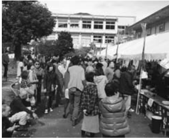
▲多くの来場者でにぎわう会場

11月16日（日）、日野町黒坂にある日野高校黒坂校舎において『第11回日野郡新そばまつり』が開催されました。今年のそばは播種後の8月後半から9月にかけて天候が不安定だったこともあり、生育に心配がありましたが出来は上々とのこと。日野郡産のそばは香りが強いのが特徴で、口に入れた時に甘さを感じます。当日は郡内外からたくさんの方が訪れ、中にはそれぞれのそば店の味比べをするために一人で数杯を食ましたというお客さんも・・・。日野郡の秋の味覚は郷土伝統の味覚でもあり、貴重な観光資源でもあります。こういったイベントを通して日野郡をさらにPRしていきたいですね。