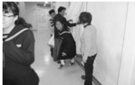
▲防火シャッターを通して避難しました

消防署員の方による講習でも「訓練したとしても話もありません。地震や火災があっても慌てることなく避難するためには、訓練は欠かせません。万が一に備えた貴重な訓練となりました。