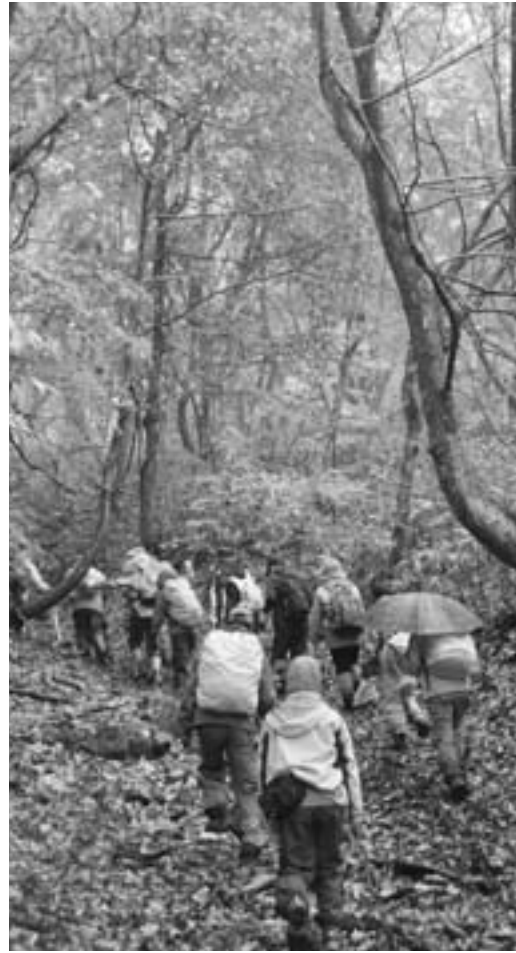
▲歴史ある古道を一步一步進む参加者