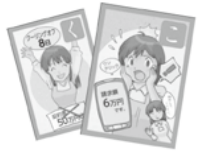
日野郡消費者いろはカルタ(H25作成)

消費生活相談窓口に入る相談は、インターネットに関するトラブルから高齢者をねらったトラブルまで年々、複雑で多様化しています。