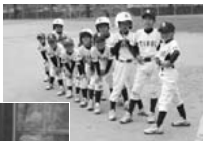
▲試合前、整列するナイン

6年生が引退して新しく編成された郡内のチーム同士が対戦し、どの選手も全力で熱気あるプレーを見せていました。時折雨が降る中での試合でしたが、チロルジュニアの選手も奮闘し、惜しくも準優勝の結果となりました。