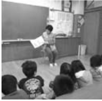
▲絵本の読み聞かせ（2年生）

江府小学校では、毎週木曜日の朝に本の読み聞かせを行っています。それでも、お助け隊のみなさんが協力して下さっています。