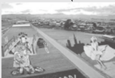
▲昨年の田んぼアート

また、田んぼアートの里としても有名で「紫稲」「黄稲」等数種類の苗を使って毎年様々な凶柄を描き、見ごろとなる7月中旬から1か月間はたくさんのお客でにぎわいを見せます。