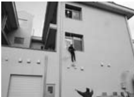
▲先生方による緩降機を使った降下体験

われましたが、突然の非常ベルに慌てることもなく、全員が落ち着いて避難することができました。生徒達の訓練終了後、「緩降機」と言われる避難器具の操作について、先生方の講習会がありました。説明を受けた後、代表で3名の先生が実際に器具を使って避難体験をされました。