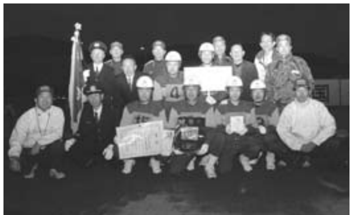
▲大会を終え、応援隊の皆さんと一緒に