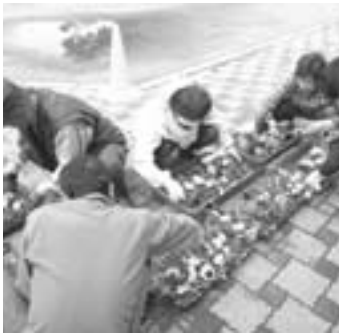
▲苗植えの準備作業

普段一緒に過ごしている先生方と違い、地域の方に読んでいただくという事で、子ども達も楽しみにしています。この日は、4名のお助け隊の皆さんが来てくださっていました。それぞれの学級で絵本の読み聞かせや朗読、語りなど工夫を凝らした読み聞かせが行われました。