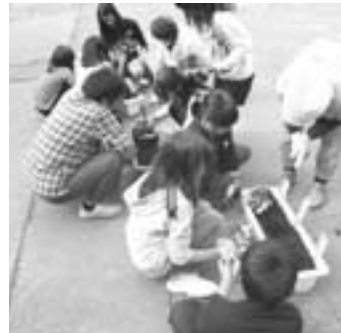
▲「花の苗はこうして植えるんだよ」

この活動にも、お助け隊のみなさんが、土づくりや土入れなどの準備や子ども達の苗植えの指導などで協力をしてくださいました。