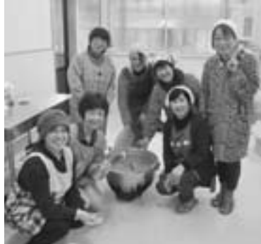
▲あつたまる団子汁を提供いただいた集落の皆さん