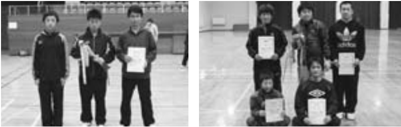
▲入賞者のみなさん

団体8チーム個人戦33人が参加し、卓球初心者の方もいる中それを感じさせないプレーで会場を大いに盛り上げていました。結果は次の通りです。