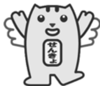
明るい選挙キャラクター 選挙のめいすいくん