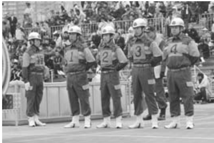
▲隊列を整え、いざ操法開始！