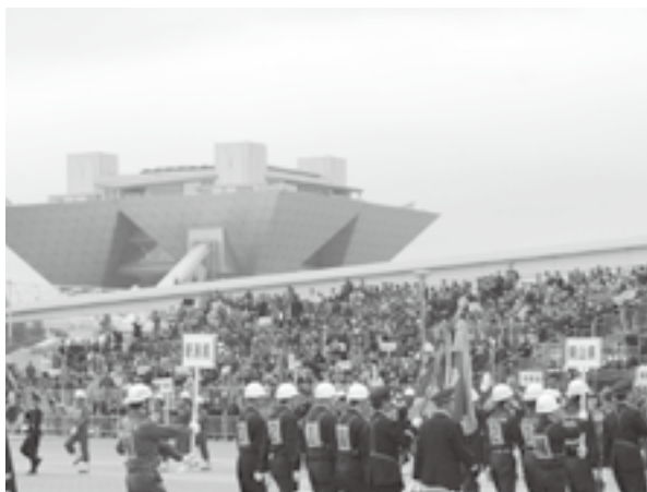
▲会場は東京ビックサイト近くの東京臨海広域防災公園