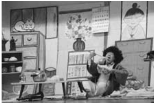
▲孤独死をテーマにした劇