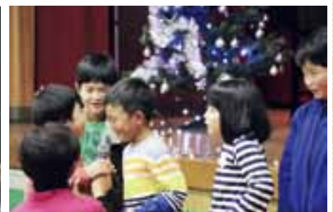
▲僕も私も歌わせて！