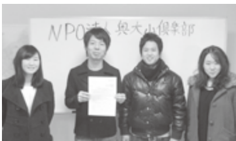
▲2015年最も記憶に残った出来事「NPO法人設立」

地域おこし協力隊の最終年度である3年目は協力隊の任期終了後もNPO法人奥大山倶楽部での活動を続けていけるような基盤作りをしていきたいと思っています。私達がこの奥大山倶楽部を立ち上げたのも「協力隊の任期が終わった後も江府町でまちづくりの活動を続けたい」といった想いがあったからです。そんな想いを実現する為にも常に新しい気持ち、視線を持って最終年度の活動に取り組んでいきたいと思っています。