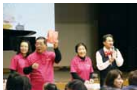
▲ドキドキわくわく抽選会