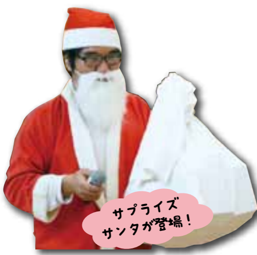
サプライズ サンタが登場！