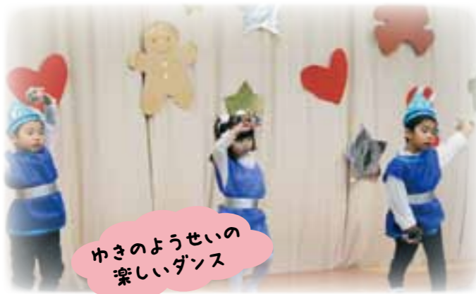
ゆきのようせいの 楽しいダンス