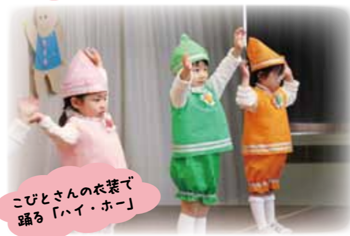
こびとさんの衣装で 踊る「ハイ・ホー」