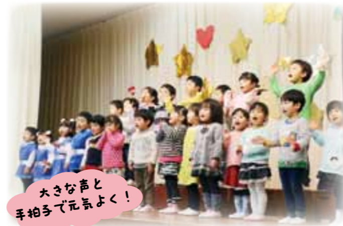
大きな声と 手拍子で元気よく！

普段の保育園の生活とは一味違う、人前で披露するダンスや劇に園児たちも緊張の表情を見せていましたが、元気いっぱいの演技を披露し、会場を沸かせていました。