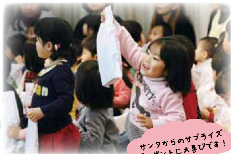
サンタからのサプライズ プレゼントに大喜びです！