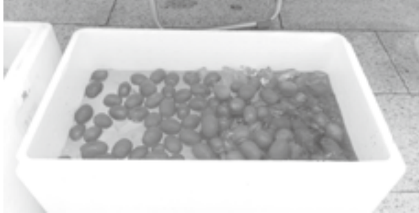
▲冷やしトマトは好評でした

今年是最終年度なので江府町に残るための仕事づくりをしていきたいと考えています。冬の間に椎茸の植菌を済ませて今年度の秋ごろに、椎茸を出荷できるように準備をし、昨秋には今年の春に取れるソラマメやんにくと言った越冬させる作物を植えることができたので、そういったものの収穫や販売も通して軌道に乗せ、定住に向けた活動をしていきます。