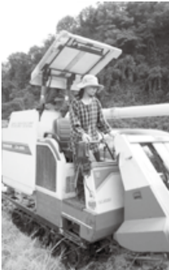
▲初挑戦のコンバイン作業

現在は、プレミアム特別栽培米のデザインに携わっています。形のないものに、形を与えるのは難しくも面白いなあと思っています。12月には、梨の新甘泉の苗木をポットに植え、支柱に誘引しました。この苗木の時期を大切に育てていきたいです。