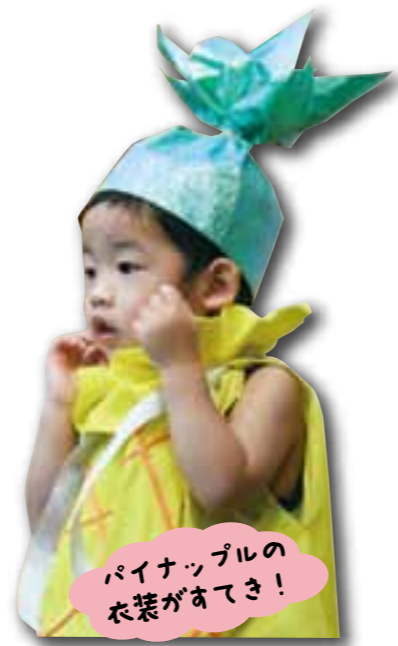
パイナップルの 衣装が素敵！