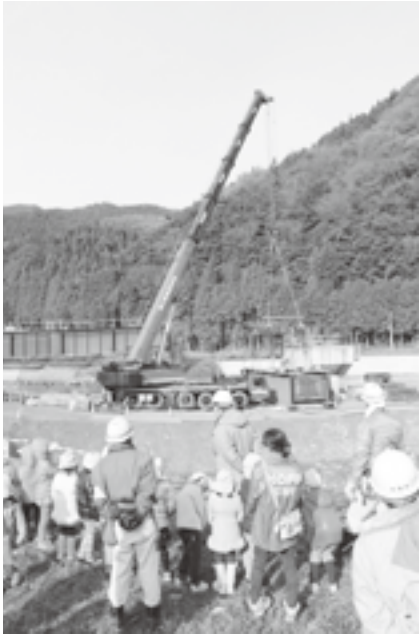
▲大きなクレーンを前に感激する園児

現場は昨年9月に完成した「下安井大橋」の隣で、現在建設作業中の江府道路の橋梁設置場所。今回の作業は重さ40トンの橋の部品を大きなクレーンでつり上げ、橋に接続するというものです。参加した園児は大きな作業車を目の前にして「大きい！すごい！」などと歓声をあげていました。また、鳥取県の工事担当者や現場作業員の方から道路や橋の説明を受けたり、小型のバックホウに乗せてもらったりと貴重な体験に園児たちも喜んでいました。