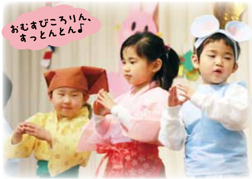
おむすびころりん、 あっとんとん♪