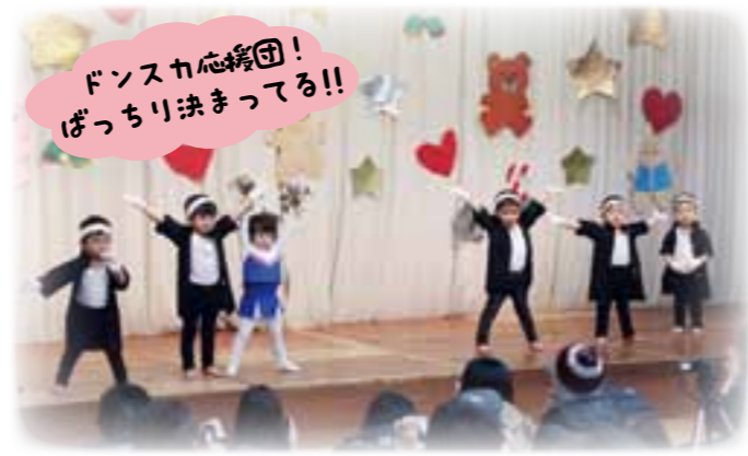
ダンスカチューシャ団！ ばっちり決まってる!!