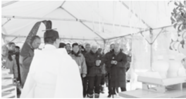
▲今シーズンの安全な運営を祈願しました

12月19日（土）、奥大山スキー場にて江府町スキー場開きが開催され、関係者やスキー客など約60名が参加しました。今年例年比に比べて降雪が少なく、スキー場開きの3日前までは地面が見えている状態でしたが、何とかこの日に間に合いました。始めに安全祈願祭を行い、今シーズンの安全を祈願した後、デモンストレーションの滑走や餅まきが行われ、賑やかなスキー場開きとなりました。