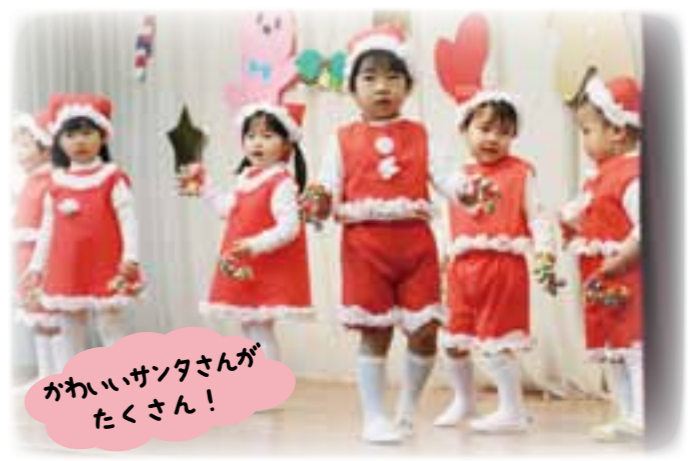
かわいいサンタさんが たくさん！