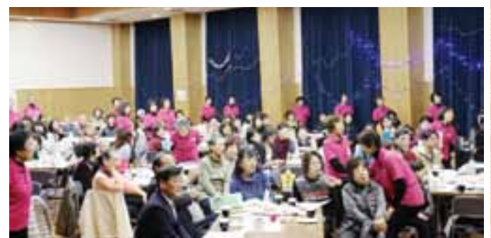
▲会場のみなさんと歌で一つになりました！