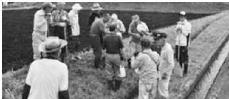
コスモスの植え付け(景観形成) 多面的機能支払（資源向上支払（共同活動））の取り組み

平成26年度から実施されている日本型直接支払制度。江府町内でも多面的機能支払制度に27組織が取り組んでいます。また環境保全型農業直接支払制度においては一つの組織が町内のたい肥を使用し環境に配慮した農業に取り組んでいます。今回は農業の有する多面的機能の発揮の促進に関する法律第7条第5項の規定に基づき、多面的機能発揮促進事業に関する計画の概要を下記のとおり公表します。