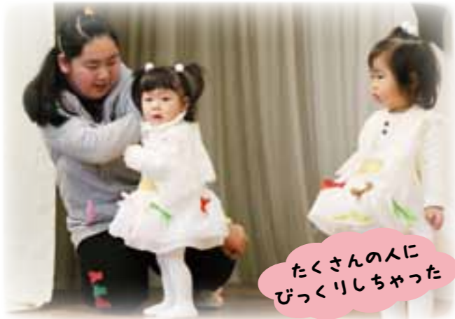
たくさんの人に びっくりしちゃった