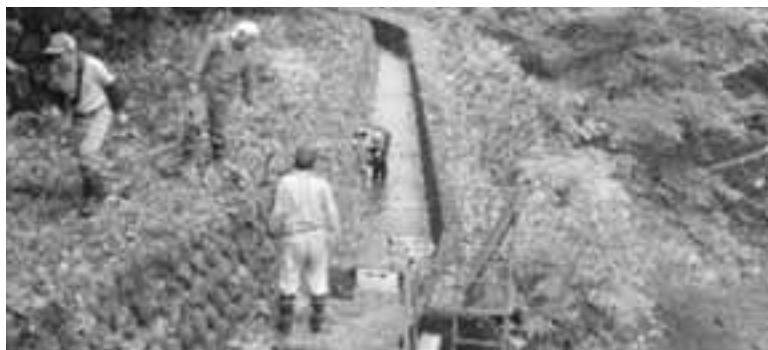
水路の泥上げ 多面的機能支払（農地維持支払）の取り組み