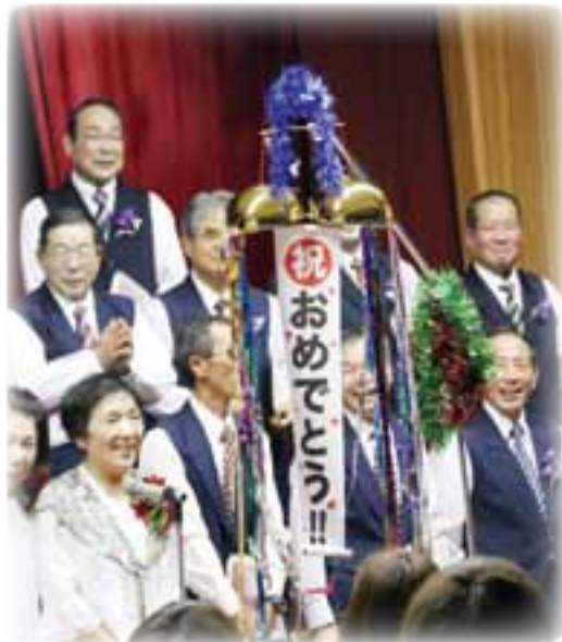
▲くす玉割で10回目のコンサートをお祝い！