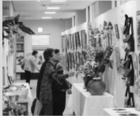
力作ぞろいの作品展示