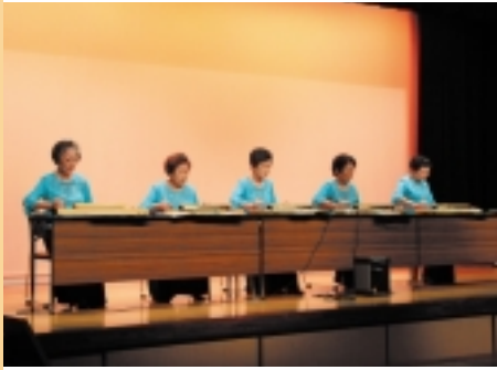
大正琴の演奏(文化祭・芸能発表会)