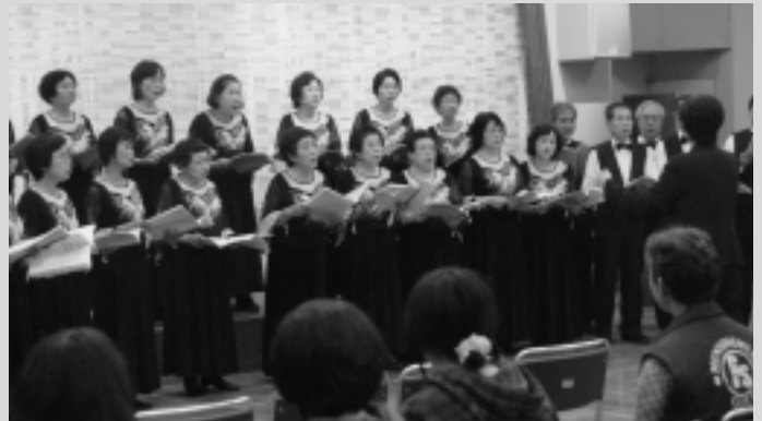
コーラス (アイリス合唱団)