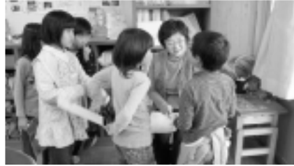
「5の段を順に言います」

ていただくことにしました。ふだんあまり話したことがない大人の人に聞いてもらうので、少し緊張気味ではありましたが、ちゃんと言えたことを褒めてもらうと、ニコッと笑顔があふれていました。学習支援のおかげで、子どもの学びの意欲も高まっていると思えました。