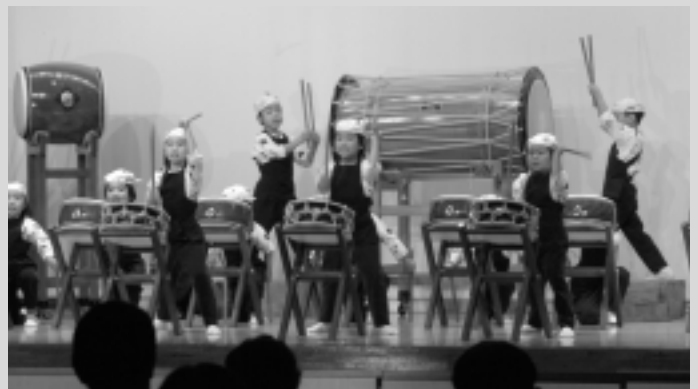
日野川子ども太鼓 (子供の国保育園)