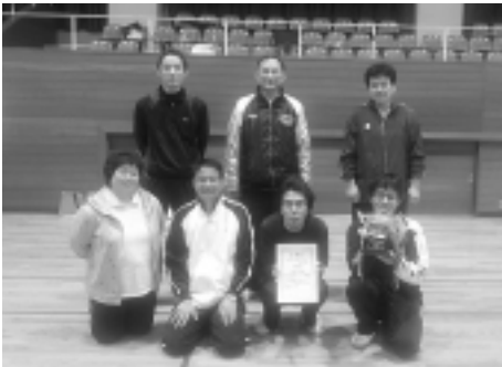
惜しくも準優勝：江府町役場チーム