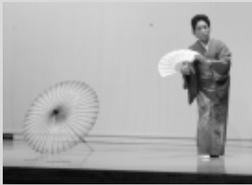
日舞 (さくらグループ)