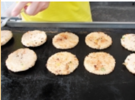
大山おこわがパンズに変身(バーガーフェスタ：おかもと旅館)