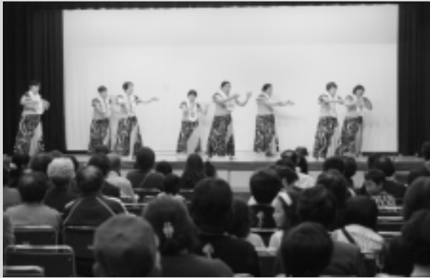
フラダンス (フラダンス教室)