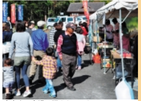
奥大山の会場は賑やかでした(旨いもんまつり)