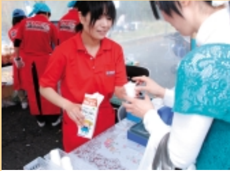
北海道別海町、牛乳も美味しかった(バーガーフェスタ)