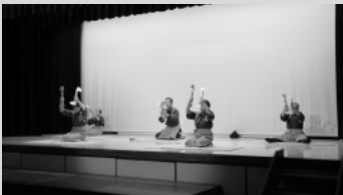
グループふく笑 (袋原-銭太鼓)