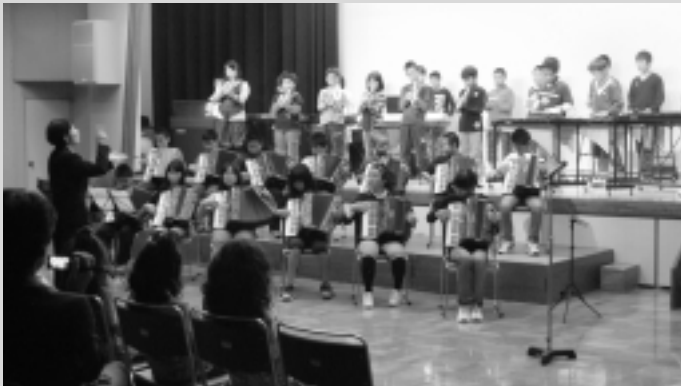
音楽演奏 (江府小学校)