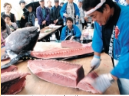
良く切れます、鮮やかな包丁裁き(本マグロの解体ショー)