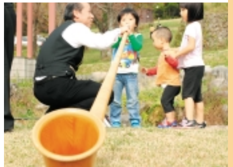
“アルプホルン”試し吹き”、音が出ました(バーガーフェスタ)