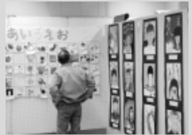
児童・生徒の作品展示