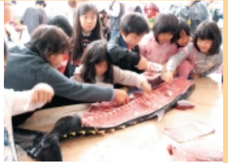
本マグロの“中おち” これ本当に旨い！(本マグロ解体ショー)