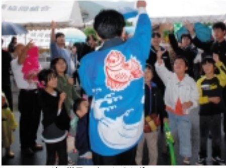
1万円のマグロ贈呈！じゃんけんポン(本マグロの解体ショー)