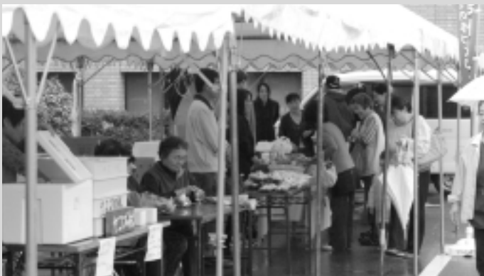
即売会 (防災情報センター前)