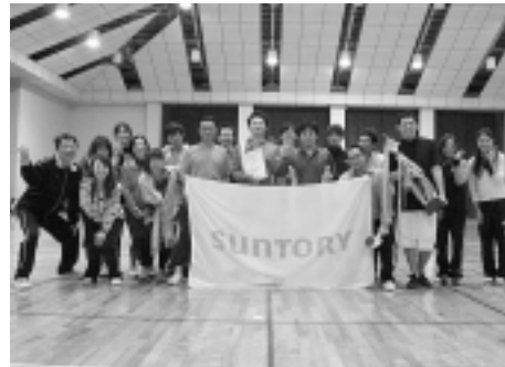
大会三連覇：サン天Cチーム