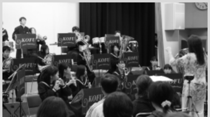
江府中学校吹奏楽部