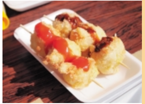
アツアツのジャガイモ丸ごとコロケ(旨いもんまつり)