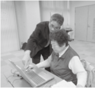
▶ 親切に指導される状況

なお三月二日で講習会は終了しましたが、ぜひ、これを機会に簿記の知識は無くてもパソコンで農業経営を考えてみたいと考えておられます方は次回ご参加の程をお待ちしております。