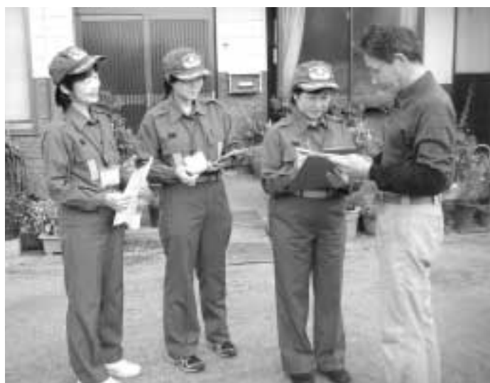
地域を巡回してアンケート調査を行う女性消防隊員

消防法の改正により、平成23年5月31日までに住宅用火災警報器については、すべての住宅への設置が義務付けられています。