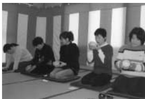
お茶会を楽しむ柿原のみなさん

二月六日、柿原活性化施設で毎年恒例の新春お茶会が行われました。このお茶会は平成六年の「うるおいのある村づくり」事業をきっかけに冬季のひとときを和やかに過ごし、語り合つ目的が始まりました。