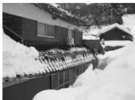
豪雪の被害を受けた住宅

町では、豪雪緊急支援金制度を設け、みなさんの災害復興支援を行っています。二月二十八日現在、七件の交付申請を受けています。