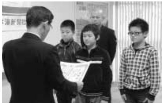
受賞の様子（チロルジュニア江府スポーツ少年団のみなさん）

江府町消防団第一分団は、第二十二回全国消防操法大会ポンプ車の部において、全国優勝を成し遂げるなど消防操法の技術向上に努め、町民の暮らしの安全、安心の確保を図り、町民に勇気と感動を与えたことが評価されました。