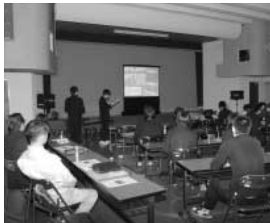
研究発表する倉吉農業高等学校の生徒のみなさん（江府町日輪閣）

二月二十二日、日輪閣で倉吉農業高等学校野菜クラブの生徒が取り組んでいる「大山スイカプロジェクト」の報告会が宮市集落の栽培農家、関係機関を集めて行われました。