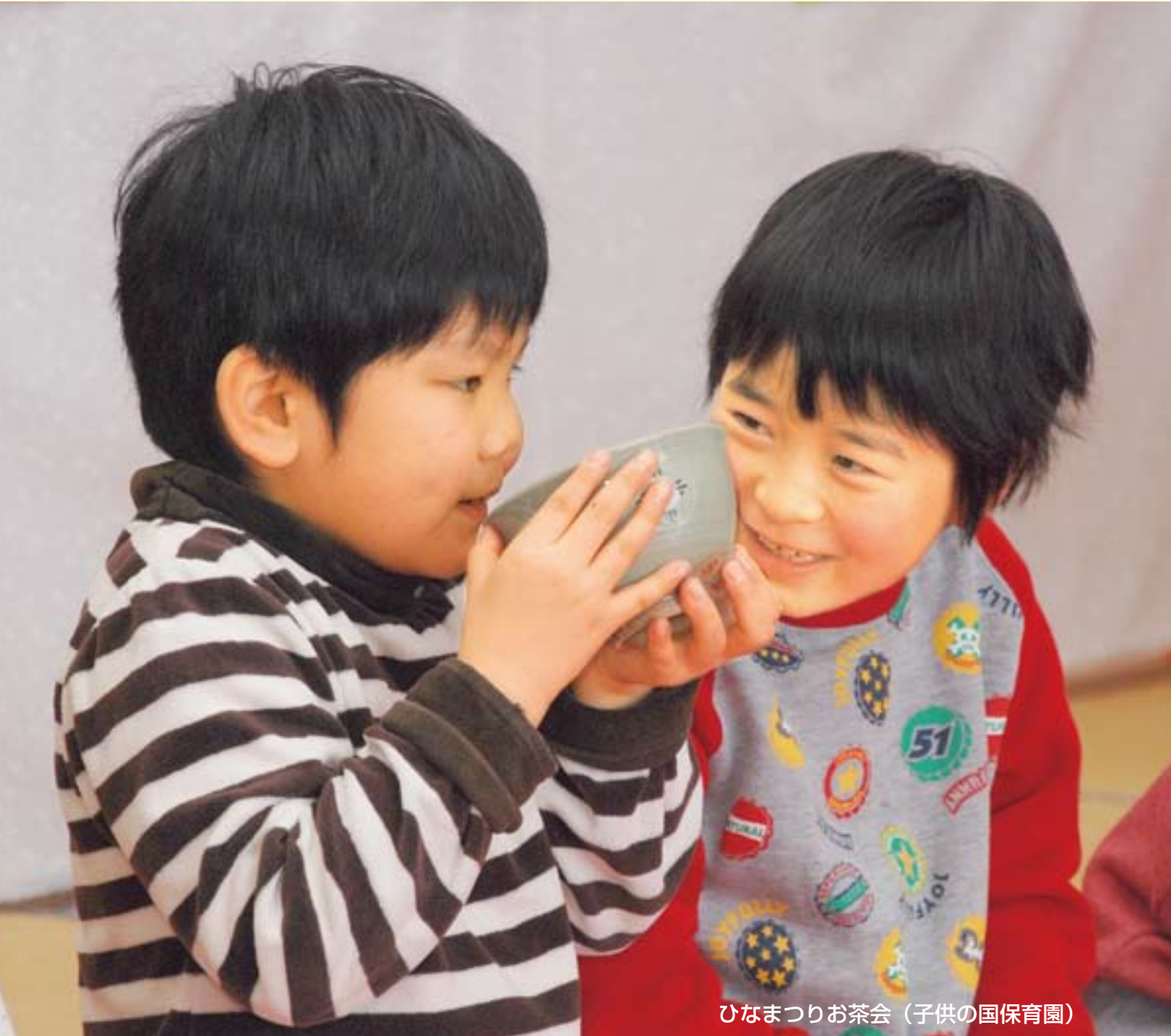
ひなまつりお茶会（子供の国保育園）