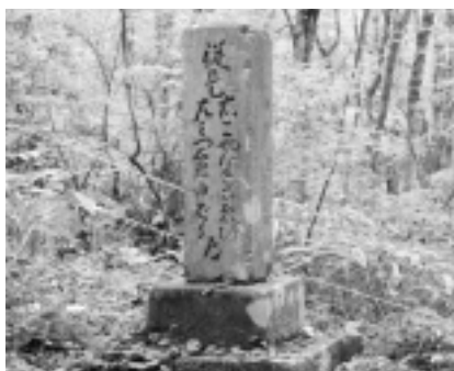
▲「從是 右こやなぎゑび 左みづくゑゆばら道」とみえる