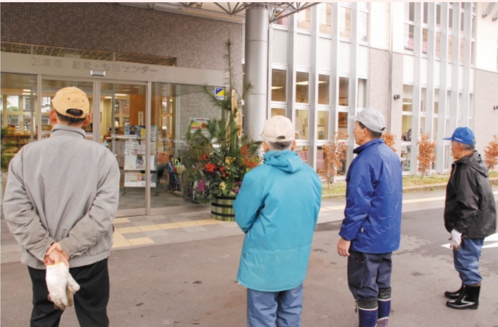
できればは。(防災・情報センター前)