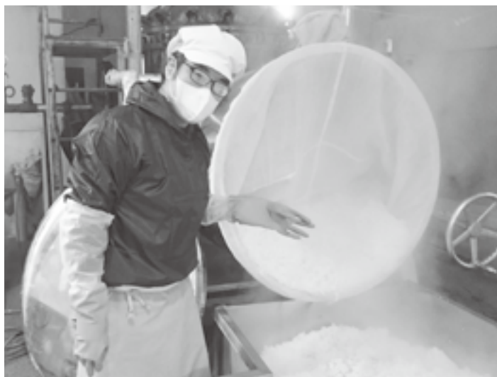
▲美味しいみそ作りのため手作業で頑張っています