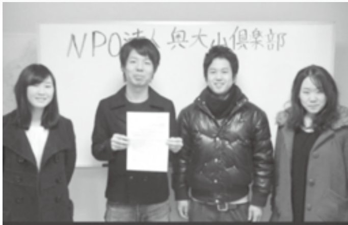
【NPO法人奥大山倶楽部活動イメージ】