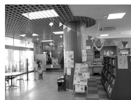
▲図書館まつりの様子

10月30日～11月7日に図書館まつりを行いました。私は、本のリサイクルを担当しました。保管期限が切れた雑誌や、古くなり利用価値が薄れた本などをお持ち帰りいただくイベントです。たくさんの方に持って帰っていただきました。町民のみなさんの大切な本を有効活用できてよかったなど、安心しております。飾りつけも頑張りました！