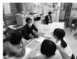
▲動画について語りました

今月は「日野郡公設塾 まなびや縁側」にて映像の分野で働く社会人として外部講師、その翌日に日野高校で動画編集ソフトの外部講師として、日野高校生達の前で話しをする機会がありました。高校生達に自分自身の考えや身に着けた事を分かりやすく伝えるためにはどうするか、話す内容を組み立てていく事で自分を振り返る機会にもなりました。高校生達の前で話す貴重な経験を得られたので、この経験も今後活かしていきたいです。