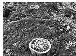
▲定植したカモミール

標高600メートルを超える黒土の大地で、来春素晴らしい花が見られることが楽しみです。