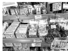
▲奥大山カモミールティー

「奥大山カモミールティー」を7月1日（木）に「道の駅奥大山」の棚に並べていただきました。種まきからはじめて、畑を耕し定植。咲いた花を摘んでお茶に。ラベルデザインを手がけ、バーコードも取得して何とか製品になりました。たくさんの皆様のご支援、誠にありがとうございました。