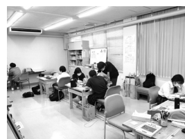
▲まなびや縁側の様子

早いもので、この8月1日で私が地域おこし協力隊として、そしてまなびや縁側の講師として着任して丸一年が経ちました。江府町での暮らしも慣れ、まなびや縁側の塾生にこの町の魅力を伝えられるようにもなりました。美味しい水、豊かな自然。そして、何より地域のみなさまの優しさ。2年目となった江府町ライフも、楽しく過ごしていきたいと思えます。