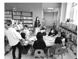
▲ものづくりクラスの様子

昨年度は休止していた「ものづくりクラス」を再開しました。6月は牛乳パックで柔らかいボールを作りました。幼児さんから小学校低学年までみんな一生懸命色を塗ったり、テープで貼ったりして、とても可愛いボールができました。作った後は、ボールを投げて遊びました。子どもたちの笑顔で楽しい会になりました。