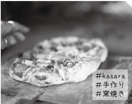
#kasara #手作り #窯焼き

古い小屋の土壁を解体して、その土でピザ釜を作ったのが去年の秋頃。その釜で今年はやパンやピザをいっぱい焼いています。熱々の釜で焼くピザやパンはとても香ばしく、おいしく焼き上がります。ピザを焼くのに最低400℃は要ります。釜の中を覗こうと、顔を近づけ過ぎると前髪と眉毛が焼けたりします。この温度でピザを焼くと、たった3分しかかからないのにしっかりと焼けます。生地の上には、とろけるチーズと旨みのあるトマトソースに、季節の野菜がトッピングされています。一度カサラファームにお越しになってピザを食べてみませんか？（菜畑）