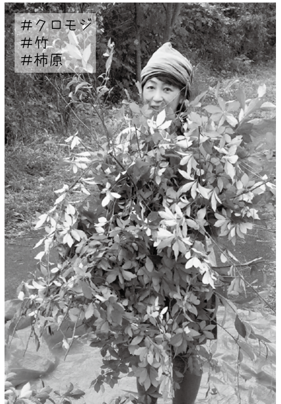
#クロモジ #竹 #柿原

今年は何年といってもモノづくりの年でした！竹とクロモジを中心に、江府町の特産品となるようなモノづくりの実験を繰り返しました。そんな中で、私にとって今年一番印象に残っている出来事は、4月の初め頃に九州より講師の方をお招きしてメンマ作りの講演をして頂き、その後柿原集落の方達と一緒に作ってみたいことです。何もかも初めての事で勝手の分からない私に、炭組合の有志の方々はじめ、集落のみなさんには大変良