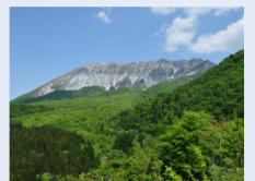
鍵掛峠から望む南大山