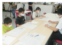
▲役場で話を伺う様子

8月18日（木）、まなびや縁側 江府拠点の塾生と一緒に「江府町役場ツアー」を実施しました。昨年1月より業務開始となった新庁舎。その建物内を案内してもらったり、役場が普段なにをやっているのかについてのお話を伺ったりしました。また、その様子をTSKさんいん中央テレビさんに取り上げていただきました。今後も生徒が江府町、そして日野郡に触れる機会をつくっていきます！