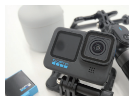
▲いつでも取れるよう購入

地域おこし協力隊になってからもうすぐ半年が過ぎようとしています。江府町での暮らしも慣れてきて、そろそろユーチューバーっぽい活動も始めたいと考えています。いつでも撮影できるようにGoPro（小型ビデオカメラ）を買ってみました。江府町の魅力を探しながら自分ができることをコツコツと進めていきたいです。