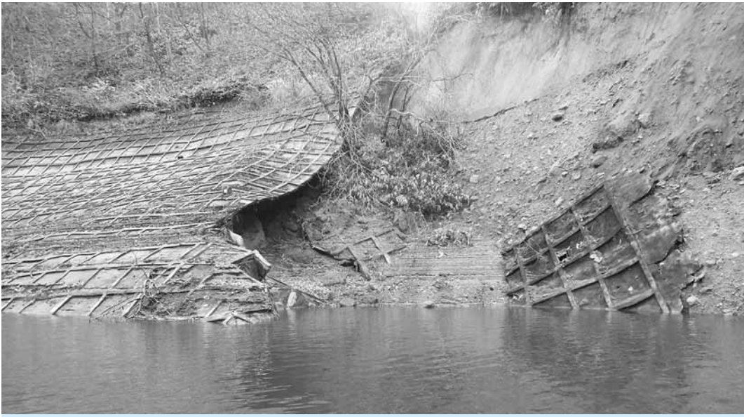
下蚊屋ダム施設災害箇所