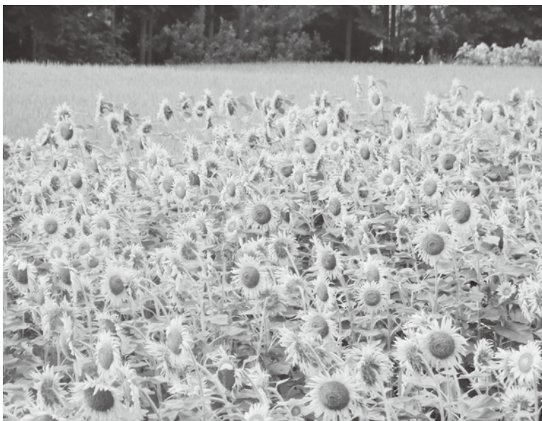
貝田んぼのひまわり

新規就農の参入を阻害する要因は、我が町の場合、下限面積というよりも、そつでないところにあるんじゃないかなと思つています。仮に下限面積を下げればちゃんと入るよというようなことが実際にでてくるようなら速やかに対応を検討していきたいというふうに考えております。