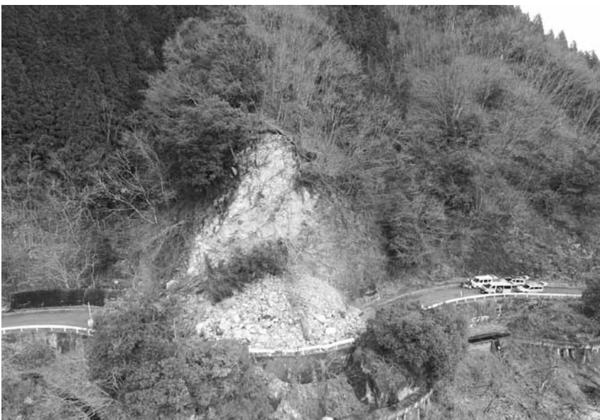
町道久連洲河崎線災害箇所