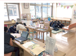
▲日野川校舎図書館の様子

日野川校舎の図書館に置が入りました。協力隊の予算で新しく買った畳をみんなで運び、入り口から見える場所に設置しました。日当たりがいいのでぽかぽか暖かく、お昼休みには、たくさんの生徒が畳でくつろぐ姿が見られます。調べ学習にはもちろんですが、リラックスできる場所としても図書館を使ってもらえるように工夫していきたいと思っています。