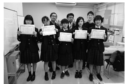
▲オリジナル卒業証書を持つ生徒の様子

今月より、年度は移り令和3年度になりました。今年度もまなびや縁側共々、何卒よろしく願いいたします。