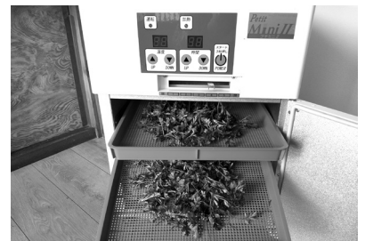
▲よもぎを食品乾燥機で乾燥する様子