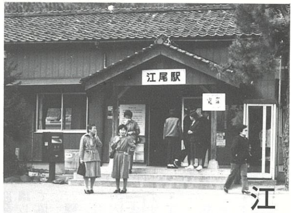
町の表玄関 江尾駅